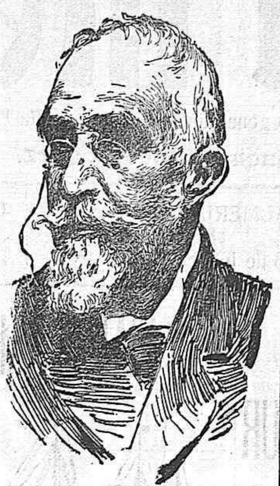
Jefe de la minoría republicana del Congreso.