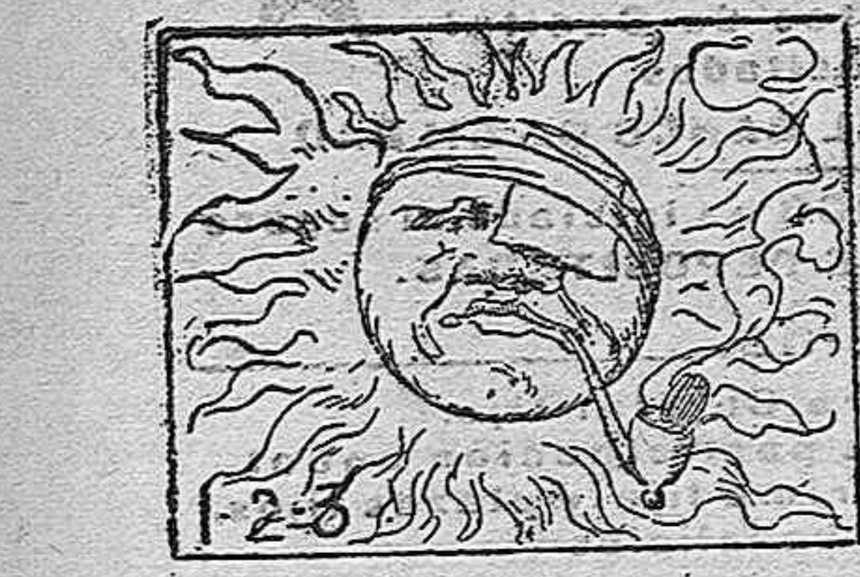
(La solución mañana).