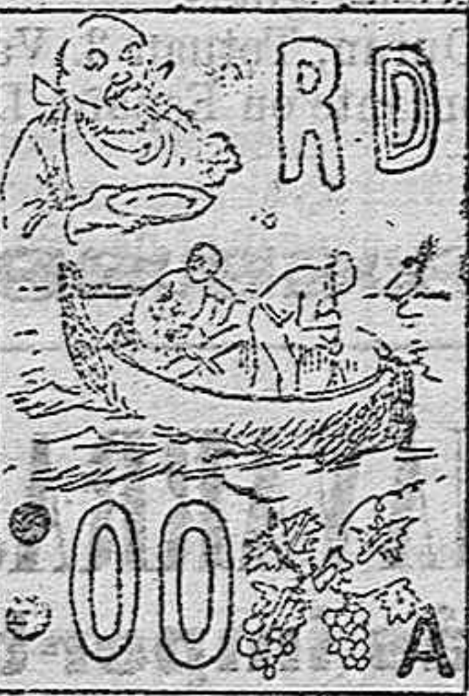
(La solución mañana).