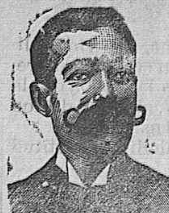
Angelo Costanzi Diputación 435.—Barra

SE ALQUILA. un local en la calle de Alava 2, al lado del Café Suro, propio para establecimiento, con casa donde habitar. En la misma calle núm. 6, infórmate.