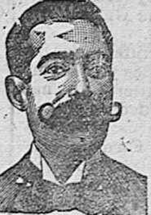
Angelo Costanzi Calle Diputación 435.—Barra