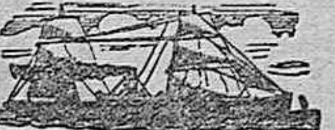
Vapor Nuevo Valencia.