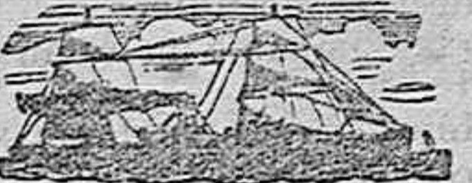
Vapor «El Fomento»