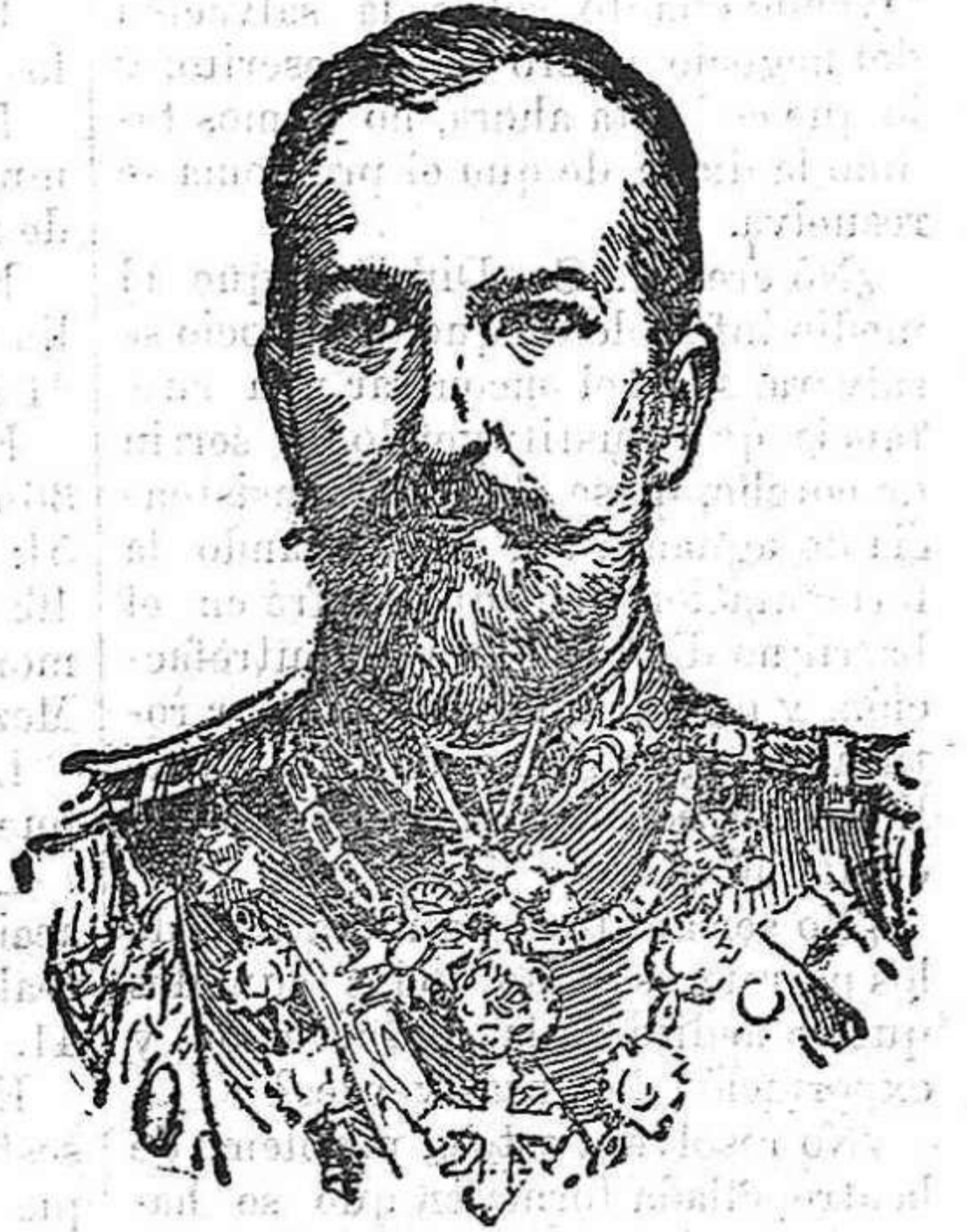
Fernando de Bulgaria

Al dictar Rusia en San Estéfano las condiciones de paz con Turquía, impuso como una de ellas la constitución de Bulgaria en principado tributario del sultán, pero autónomo y con gobierno cristiano. El tratado de Berlín de 1878 acordó la autonomía búlgara y eligió príncipe soberano á Alejandro de Batemberg, el que en 1887, después de haber lo-