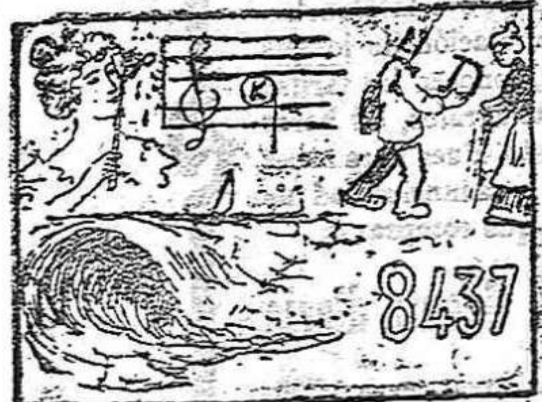
La solución mañana.