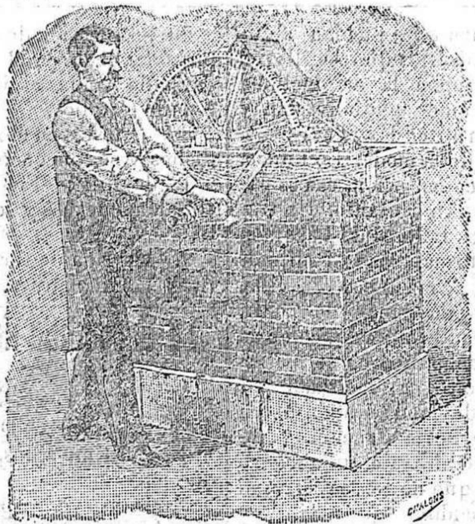
NORIA DEL NÚMERO 1 AL 5.