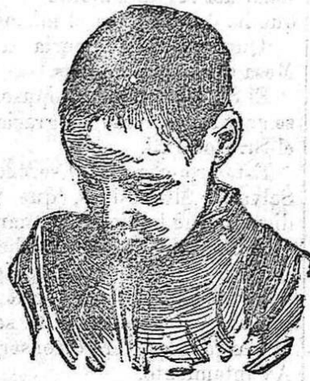
Después de usar el Capilho