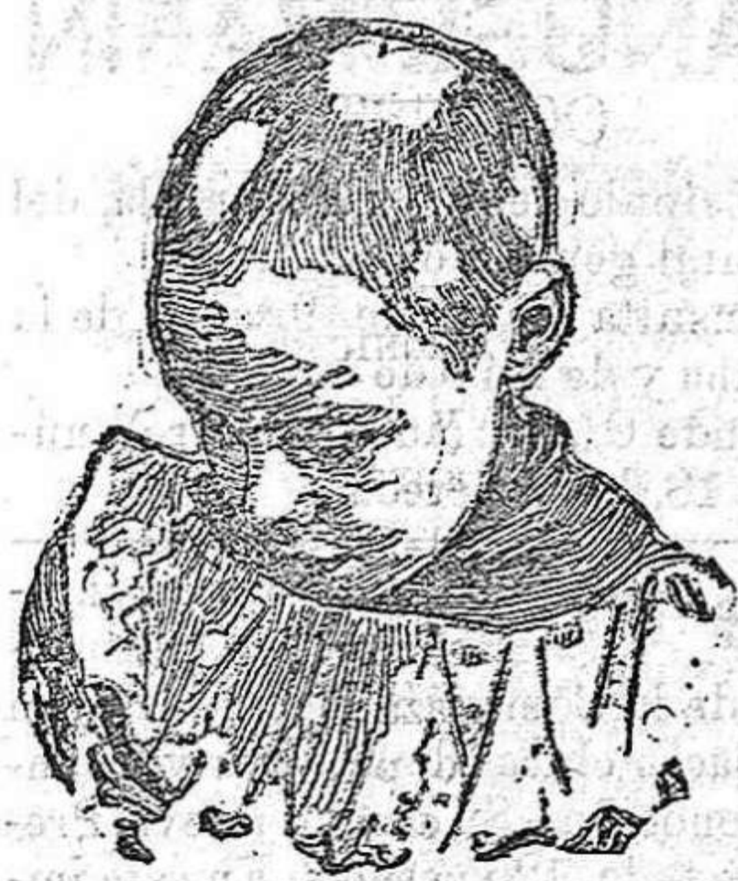
Antes de usar el Capilhol.