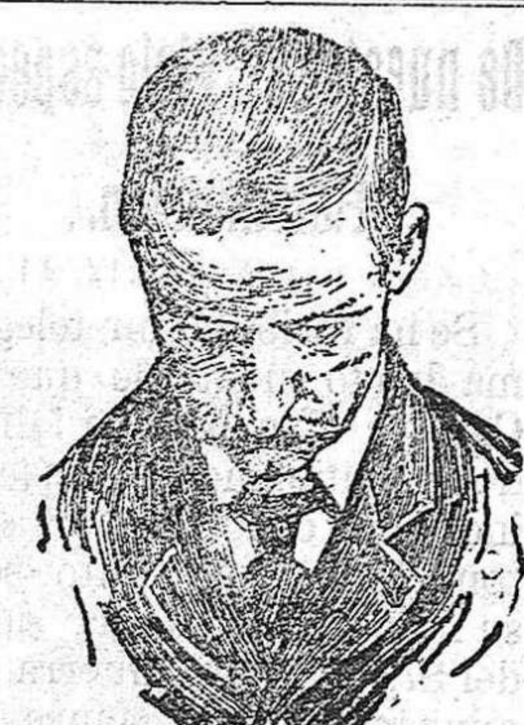
Despues de usar el Capilho