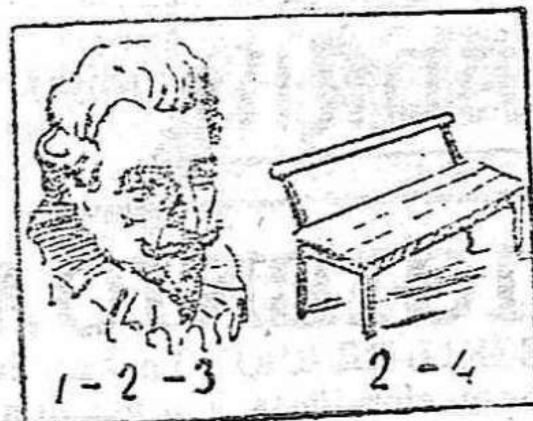
(La solución mañana.)

Solución al geroglífico de ayer: Hermosa panacea. CHARADA EN ACCION.