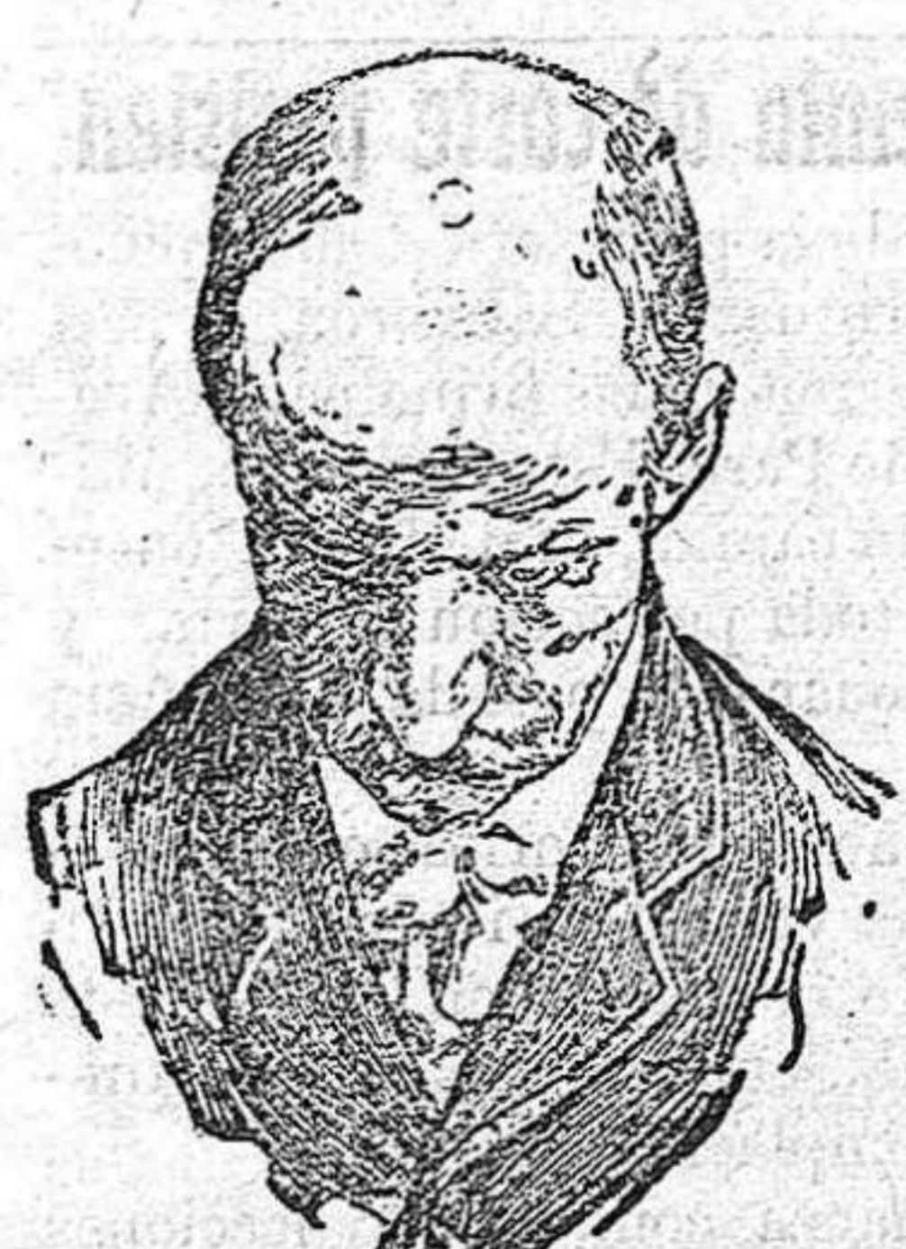
Antes de usar el Capilhol.

Frascos á 2 y 4 pesetas. Depósito central: Farmacia de Calvache, plaza del Progreso, 21, Madrid. En Almería, Droguería de Arca de Noé.