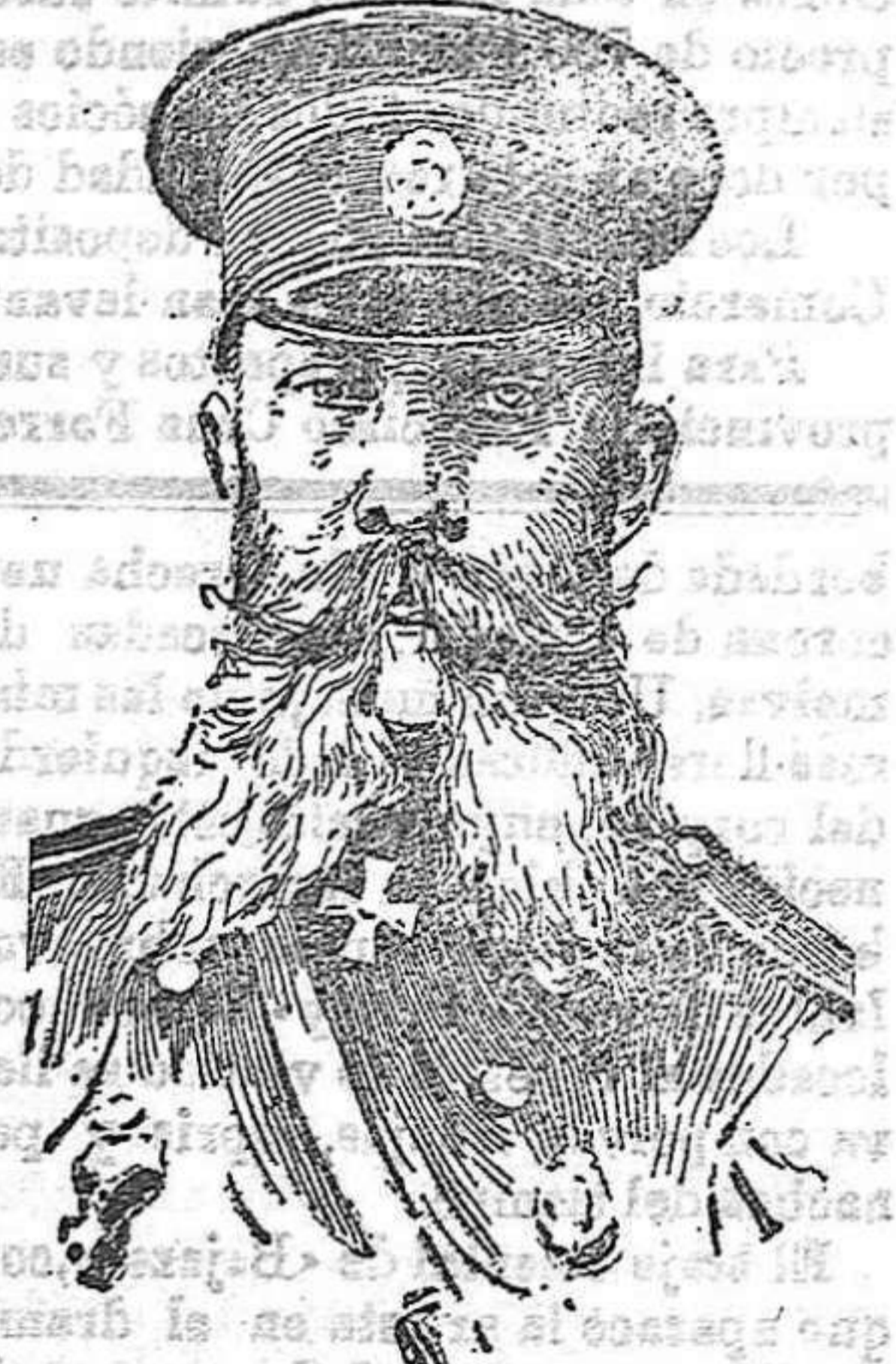
El general Grippenberg, comandante del primer cuerpo de ejército ruso, de cuyo relevo se ha hablado, a consecuencia de su derrota en el combate Sandepu.