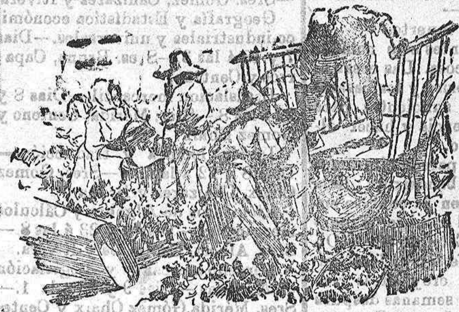
LA VENDIMIA EN REQUENA.