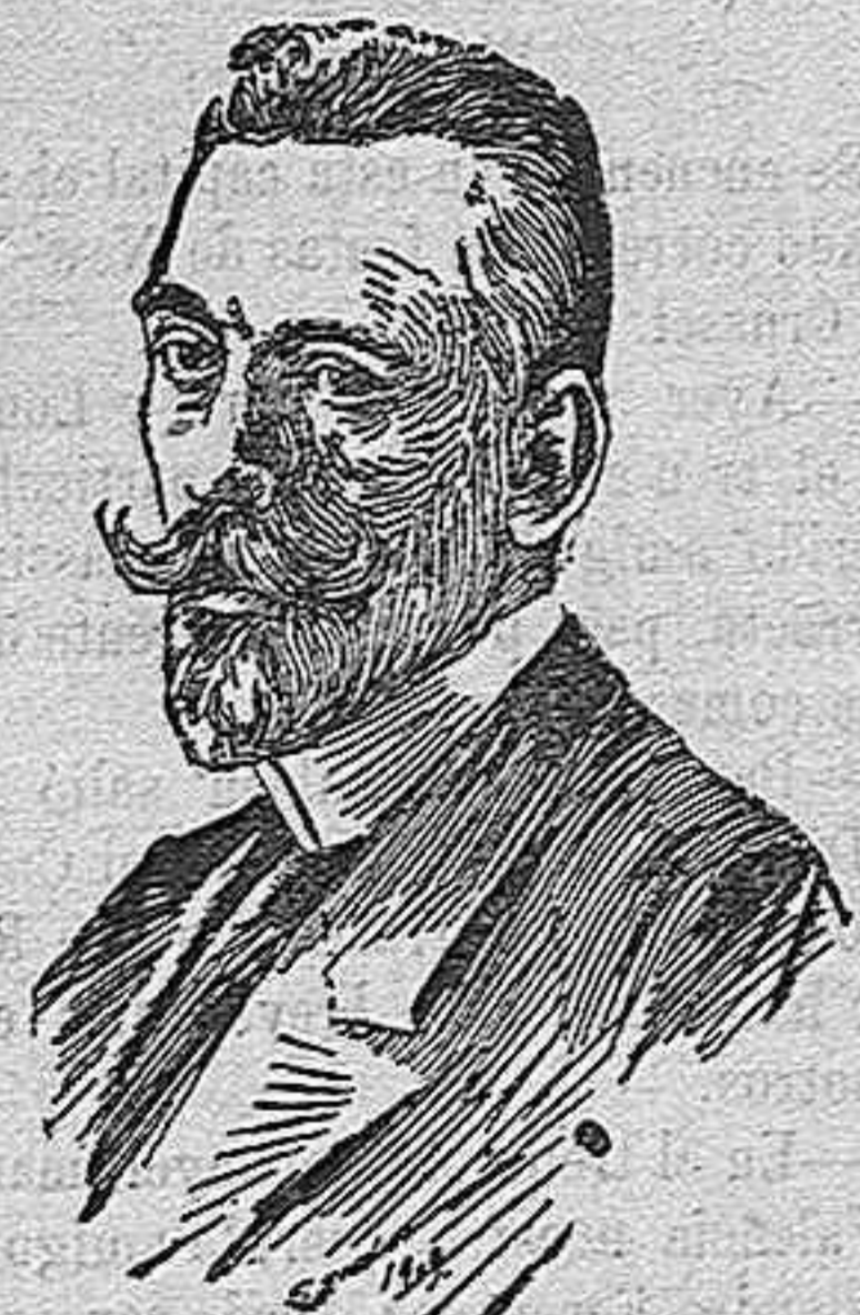
Von Bethmann-Hollreg, nuevo canciller de Alemania.

Confirmando las noticias que afirmaban ser el secretario de Estado, von Bethmann-Hollreg, el candidato que más probabilidades reunía, para suceder al príncipe de Bulow en la cancillería del imperio alemán, el telegrafo nos ha anunciado que aquel ha sido el elegido por Guillermo II para tan alto puesto... y para hechar a tiempo un capote cuando el amo y señor, por meterse en todo, dé el golpe en la herradura y no en el clavo.