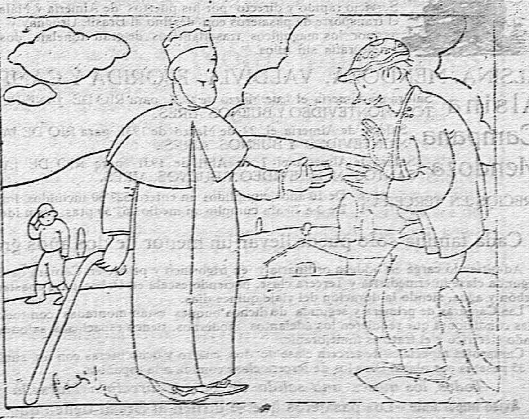
NO ES LO MISMO

Continúa al final de la última columna de la segunda plana