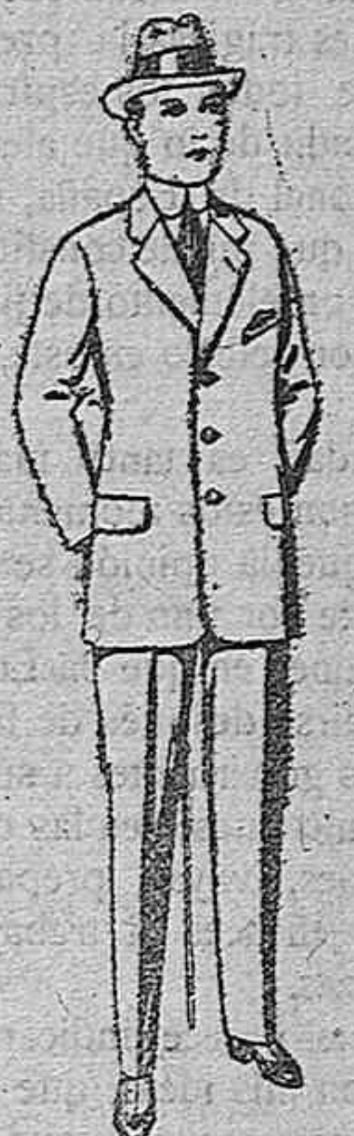
Trajes de patén, vicuña o jerga, paraniños de 10 a 12 años. De pesetas 15 a 50.