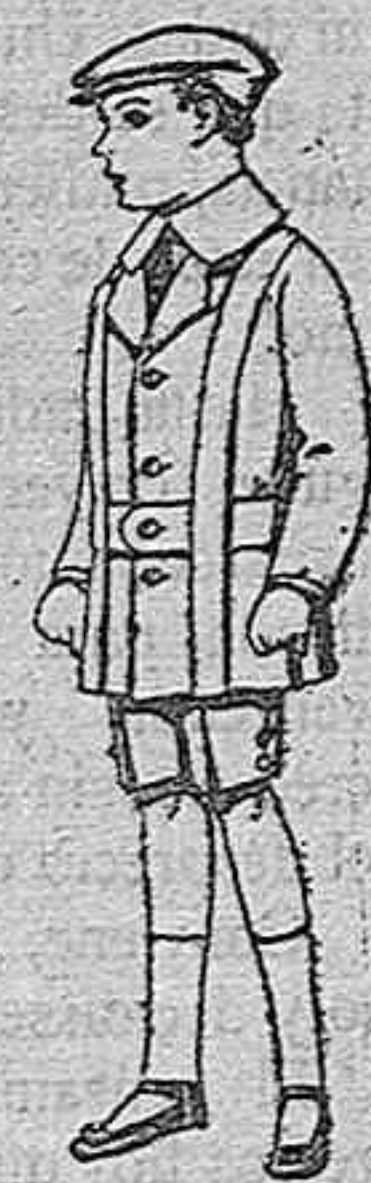
Trajes de patén para niños de 4 a 9 años. De pts. 12 a 33.