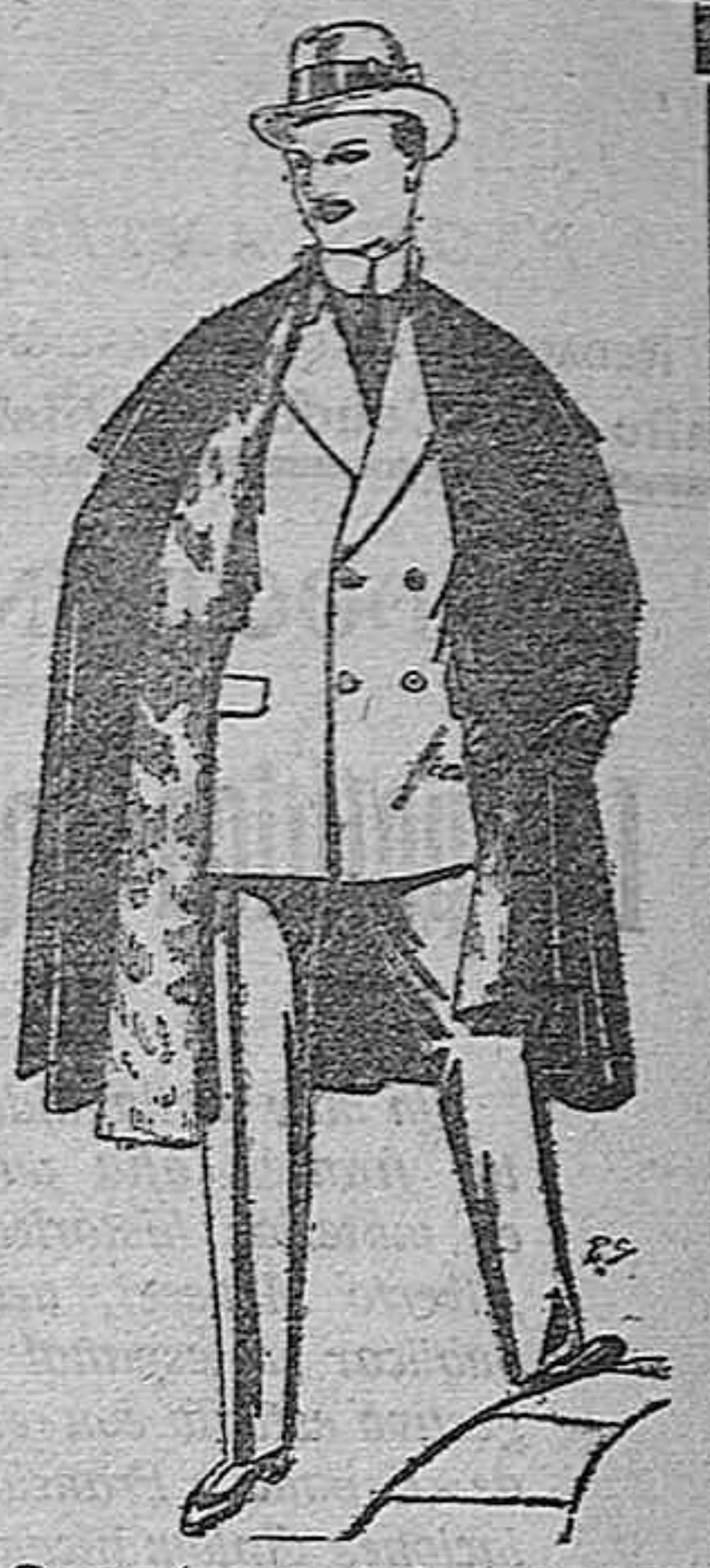
Capas (enteras) de paños de Béjar y Tarrasa, embozos de peluche, terciopelo, astrakán a escocés. De pesetas 35 a 115.