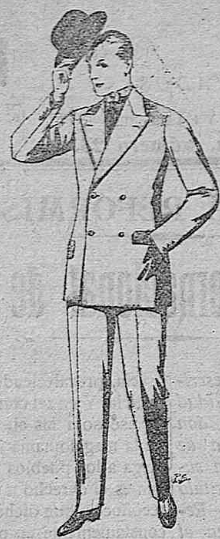
Trajes de cheviot, patén, etc. De pesetas 27 a 80. Trajes de vicuña o jerga. De pesetas 30 a 85. Los mismo, a medida. De pesetas 65 a 136.