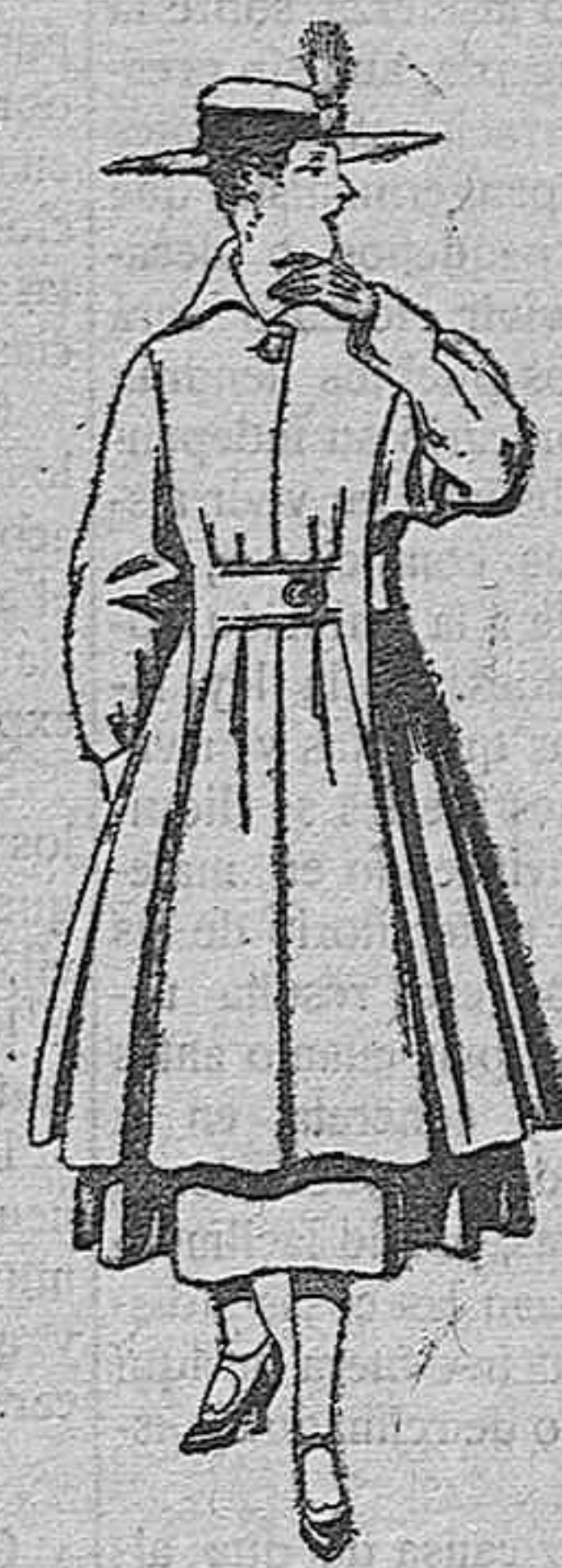
Abriego de patén, para señora. De pesetas 65 a 75.