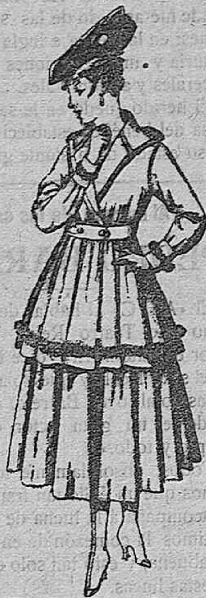
Traje de punto, en color, para señora. De pesetas 100 a 130.