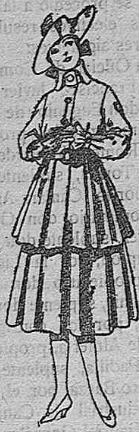
Trajes de lana, para jovencitas de 12 a 15 años. De pts 45 a 55.