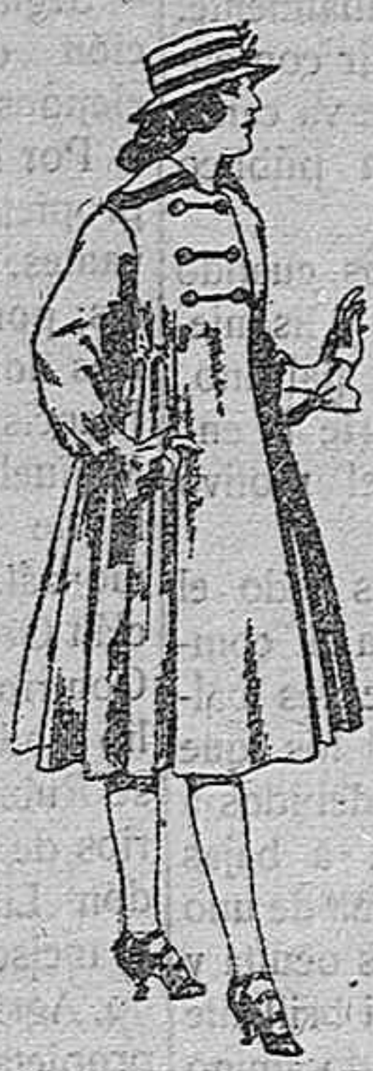
Abrigos de patén para jovencitas de 11 a 15 años. De pts 35 a 50.