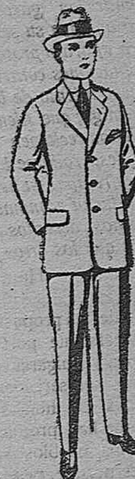
Trajes de patén, vicuña o jerga, para niños de 10 a 12 años. De pesetas 15 a 50.