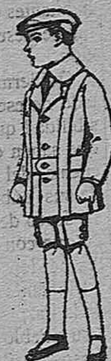
Trajes de patén para niños de 4 a 9 años. De pts. 12 a 33.