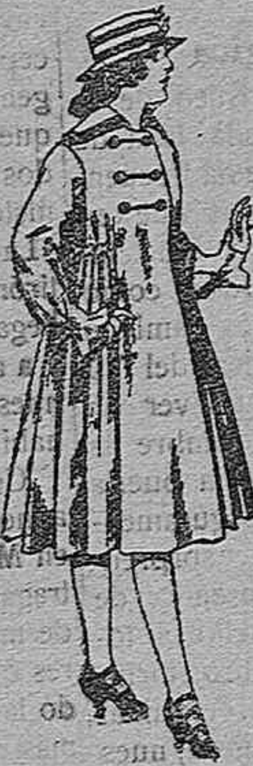
Abrigos de patén para jovencitas de 11 a 15 años. De pts. 35 a 50.