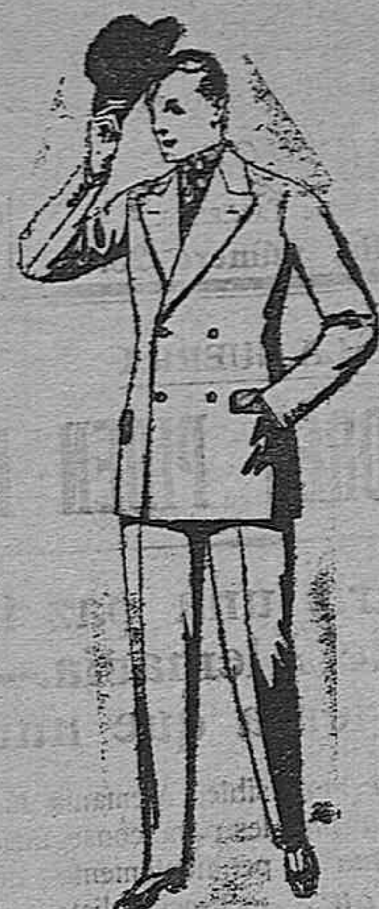
Trajes de cheviot, patén, etc. De pesetas 27 a 80. Trajes de vicuña o jerga De pesetas 30 a 85. Los mismos, a medida. De pesetas 65 a 136.