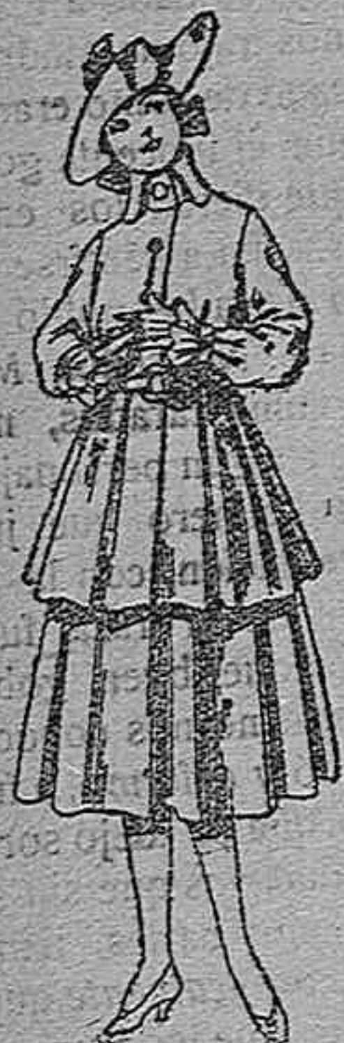
Trajes de lana, para jovencitas de 12 a 15 años. De pts. 45 a 55.