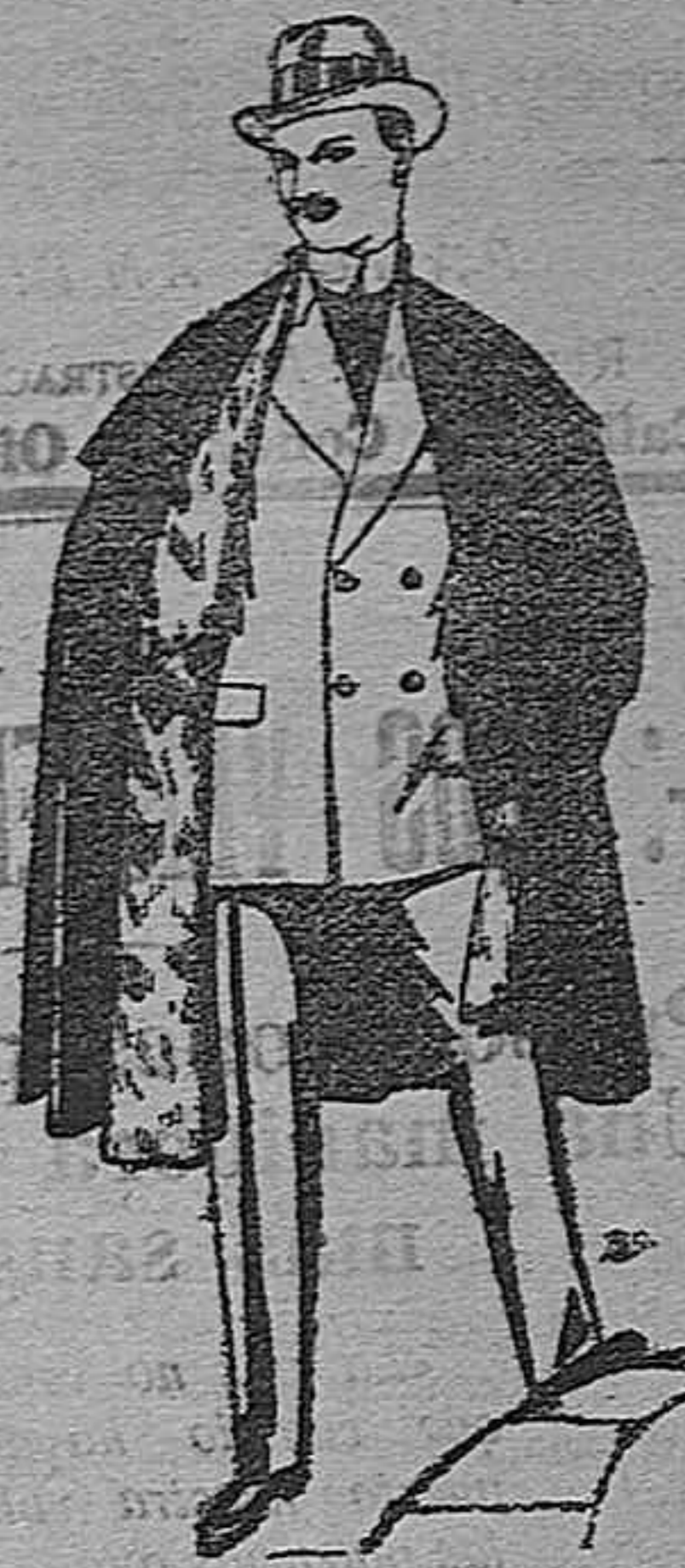
Cebs (enteras) de paños de Bejar y Tarrasa, embcos de peluche, terciopelo, astrakán a escocés. De pesetas 35 a 115.