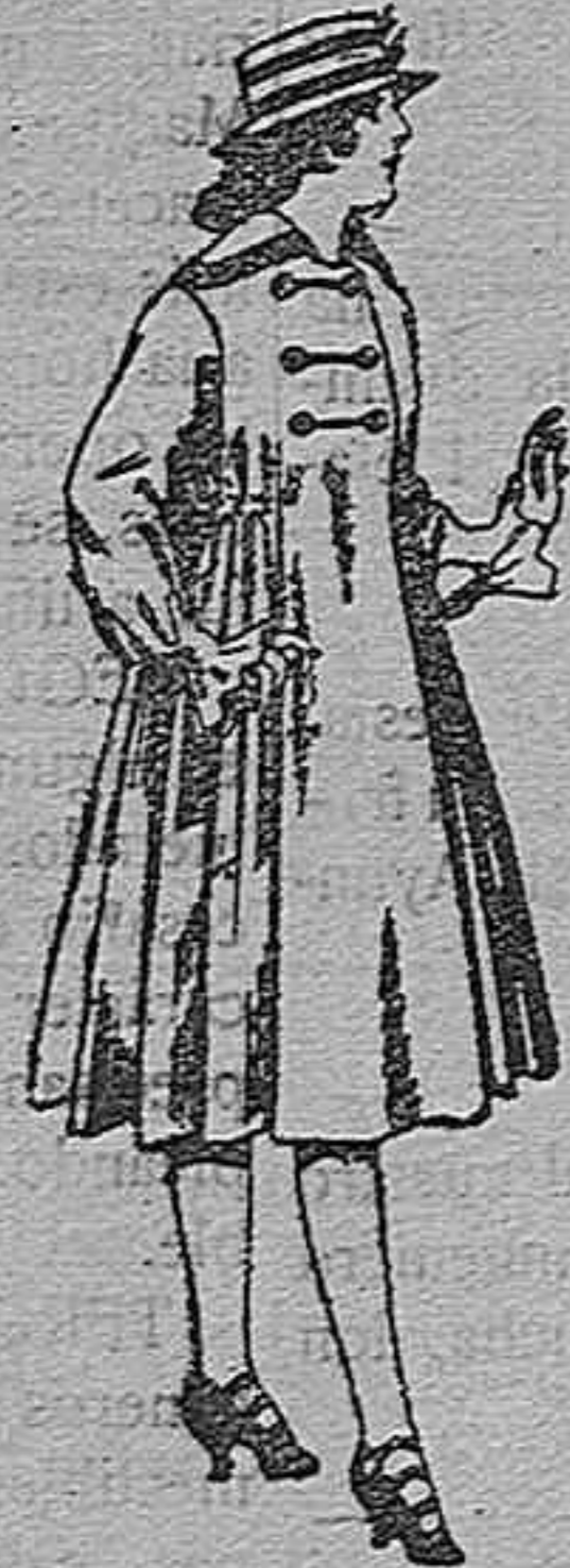
Abrigos de patén para jovencitas de 11 a 15 años. De pts. 35 a 50.