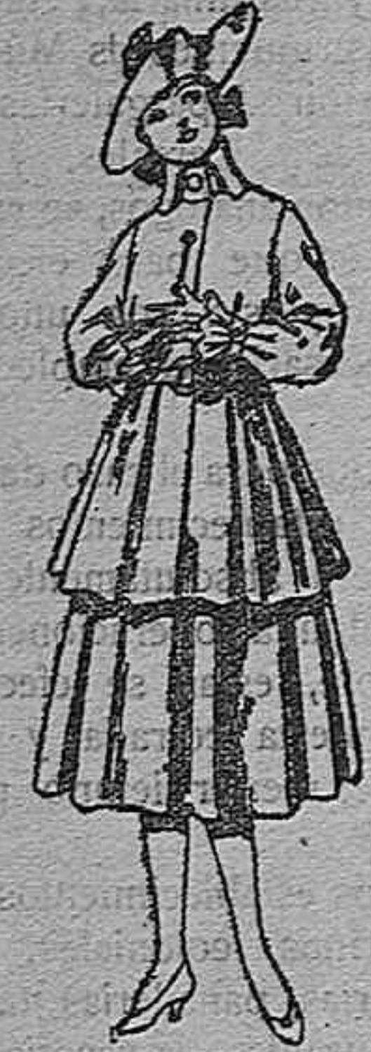
Trajes de lana, para jovencitas de 12 a 15 años. De pts. 45 a 55.