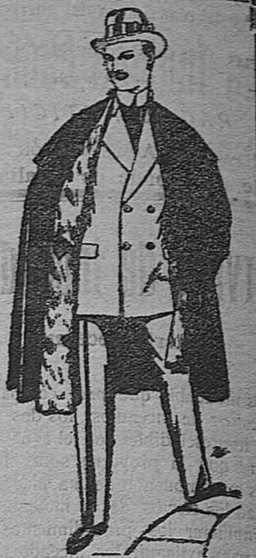
Capas (enteras) de paños de Béjar y Tarrasa, embudos de peluche, terciopelo, astrakán a escocés. De pesetas 35 a 115.