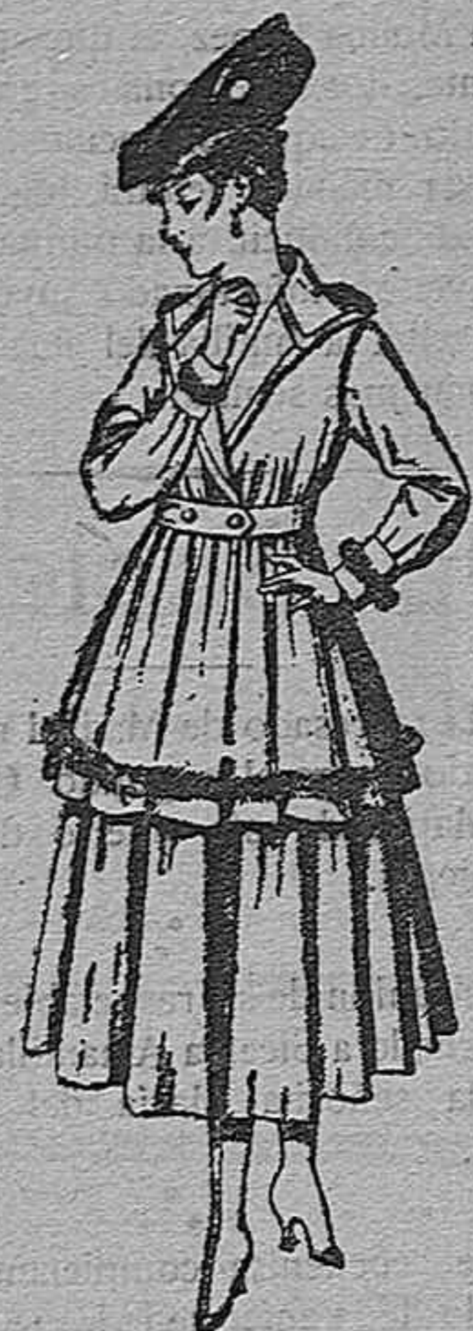
Gabanes de patén o cheviot, con cinturón. De pesetas 50 a 110. Los mismos a medida. De pts. 65 a 145.