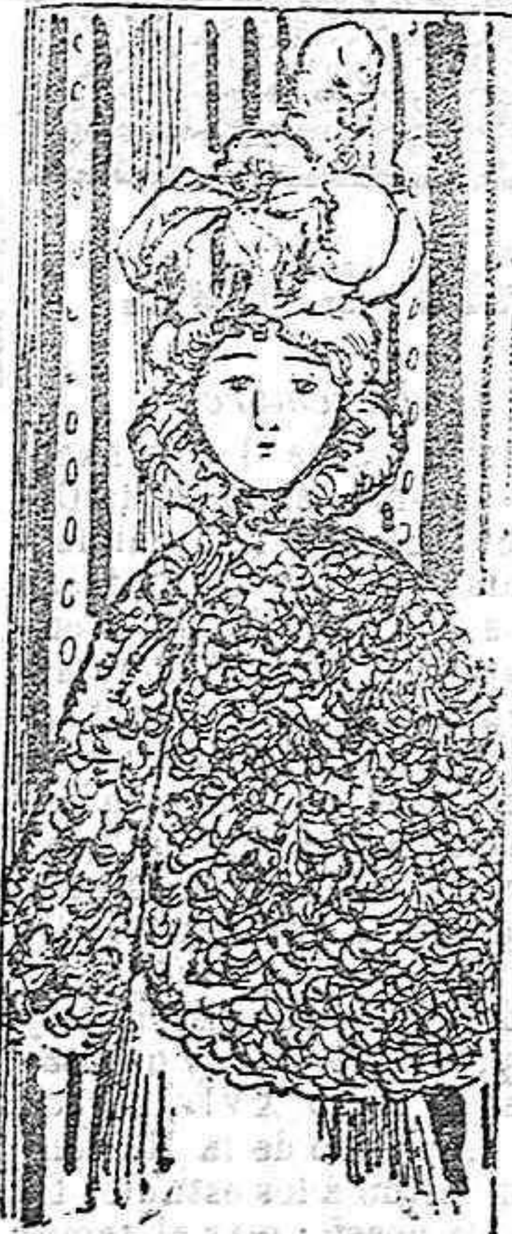
CAPA PARA SEÑORITA.

Modelos exclusivos para nuestras lectoras.