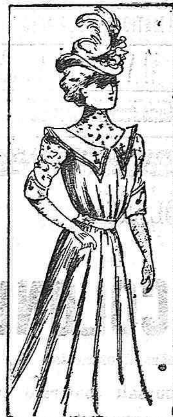
TRAJE PARA SEÑORITA.

Modelos exclusivos para nuestras lectoras.