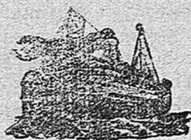
El correo trasatlántico