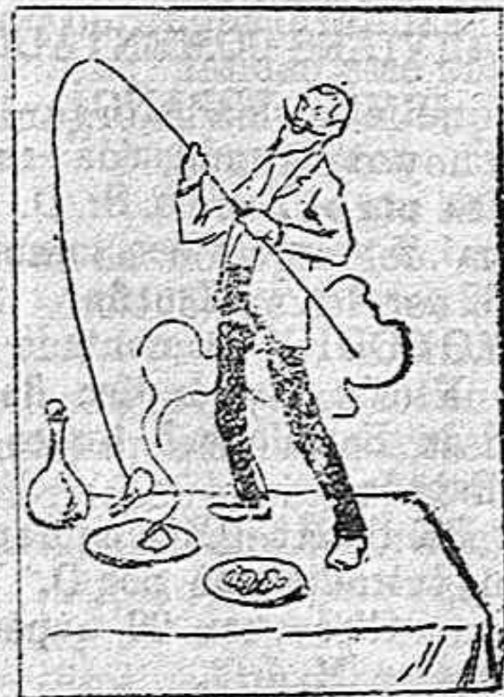
(La solución mañana).