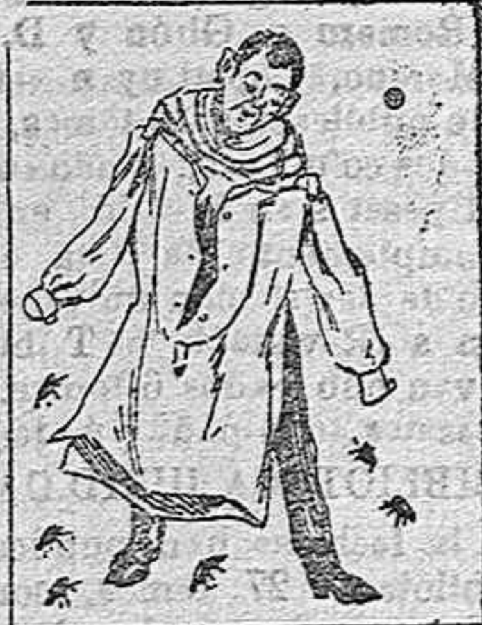
(La solución mañana.)