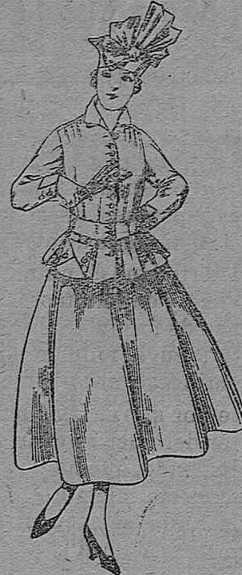
Trajes de lanilla negra, azul y color A pesetas 70