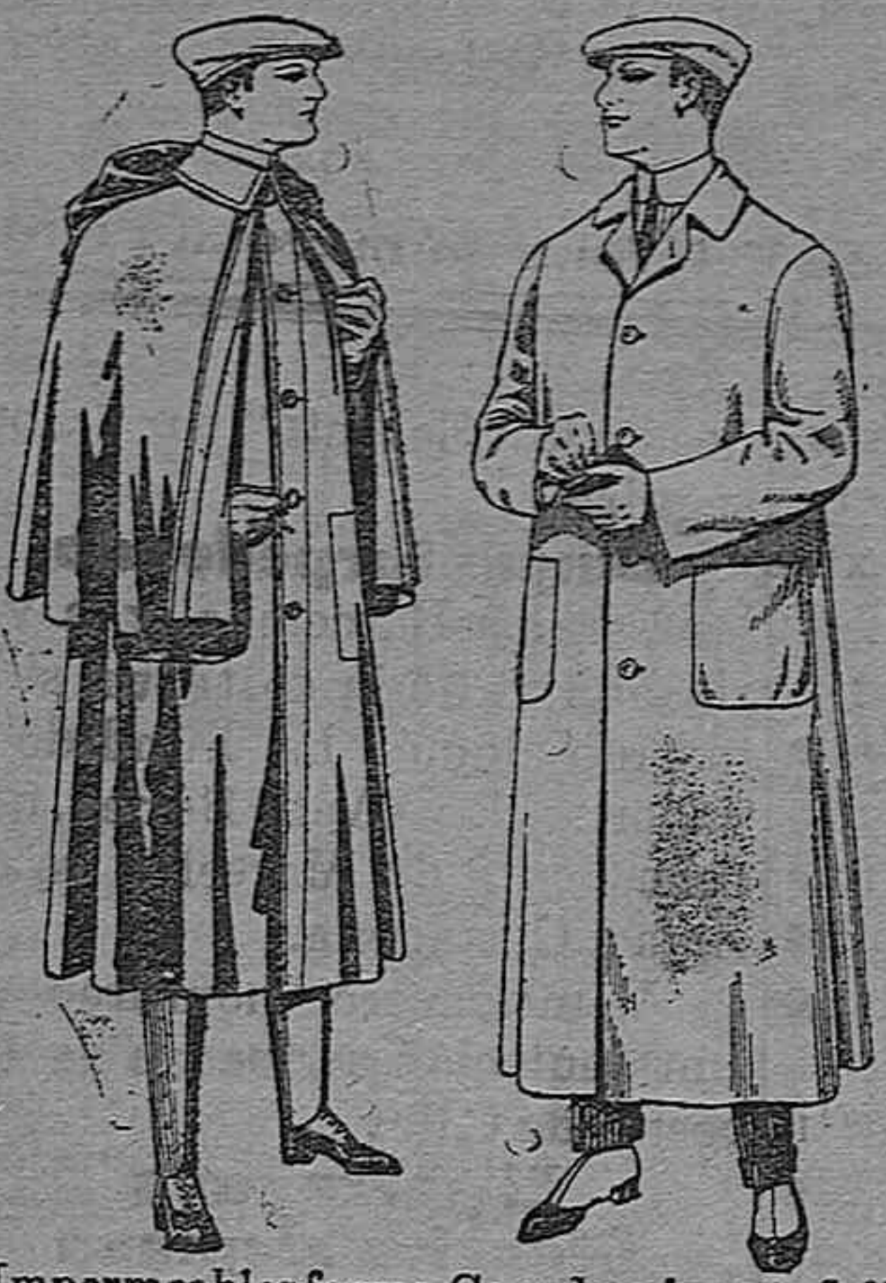
Impermeables forma Guardapolvos de dril mackferland en negro y azul De pesetas 55 á 100 De pesetas 6 á 11