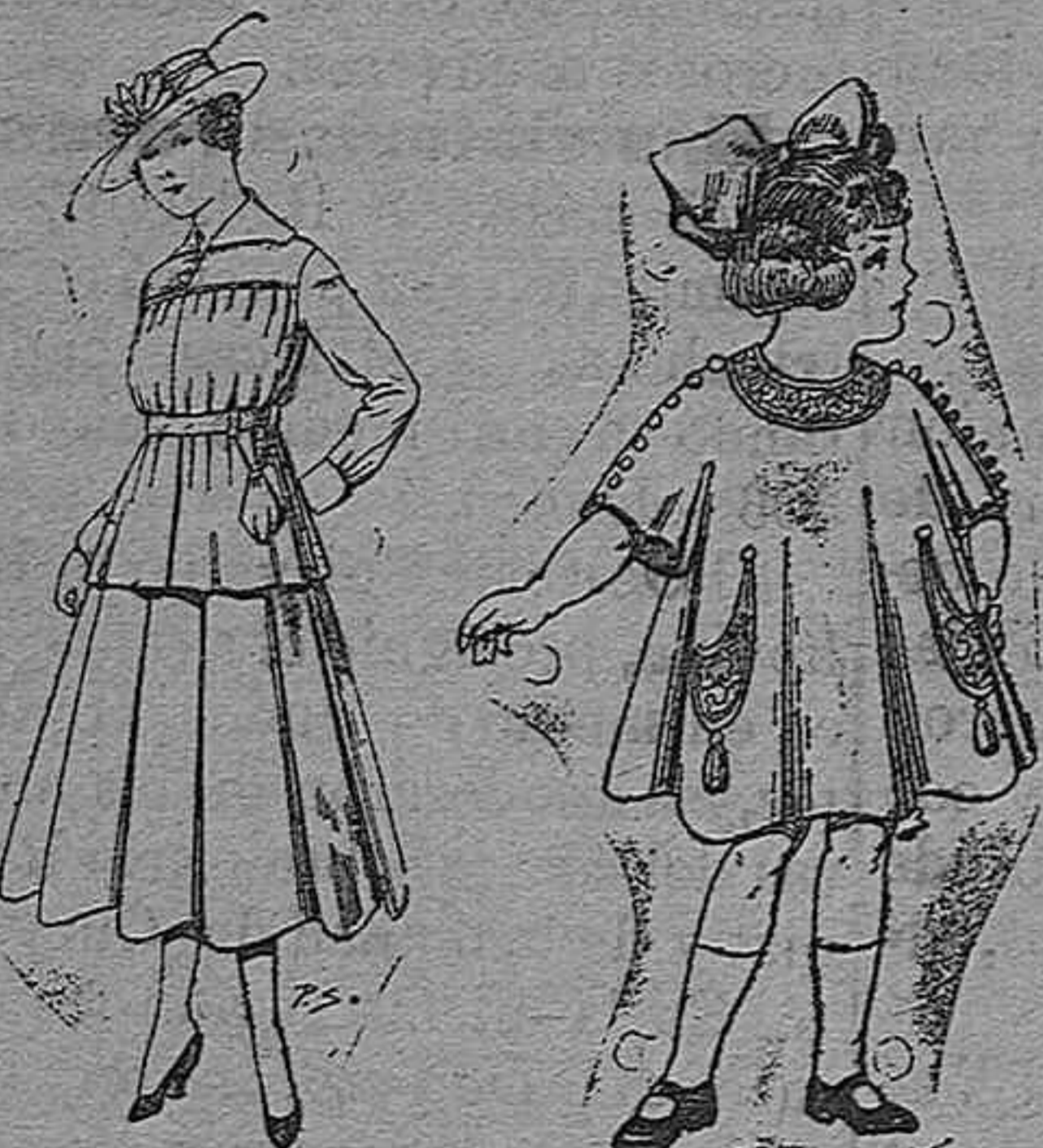
Trajes de lanilla Vestidos de lanilla para para jovencitas de niñas de 4 á 9 años 13 á 19. Pt. 50 á 55 De pesetas 30 á 38

CAMISERÍA, GÉNEROS DE PUÑO, CORBAJERÍA, SOMBRERERÍA, ZAPATERÍA, PARAGÜES, BASTONES Y ARTÍCULOS DE VIAJE