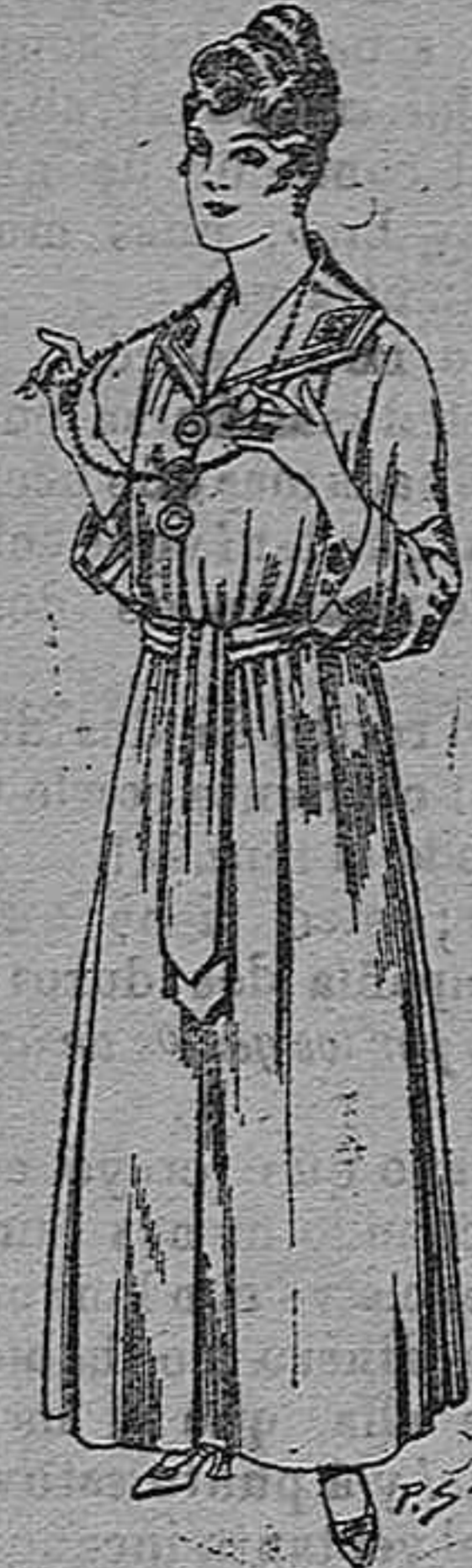
Bata de crespon color, cuello bordado De pesetas 6 á 11