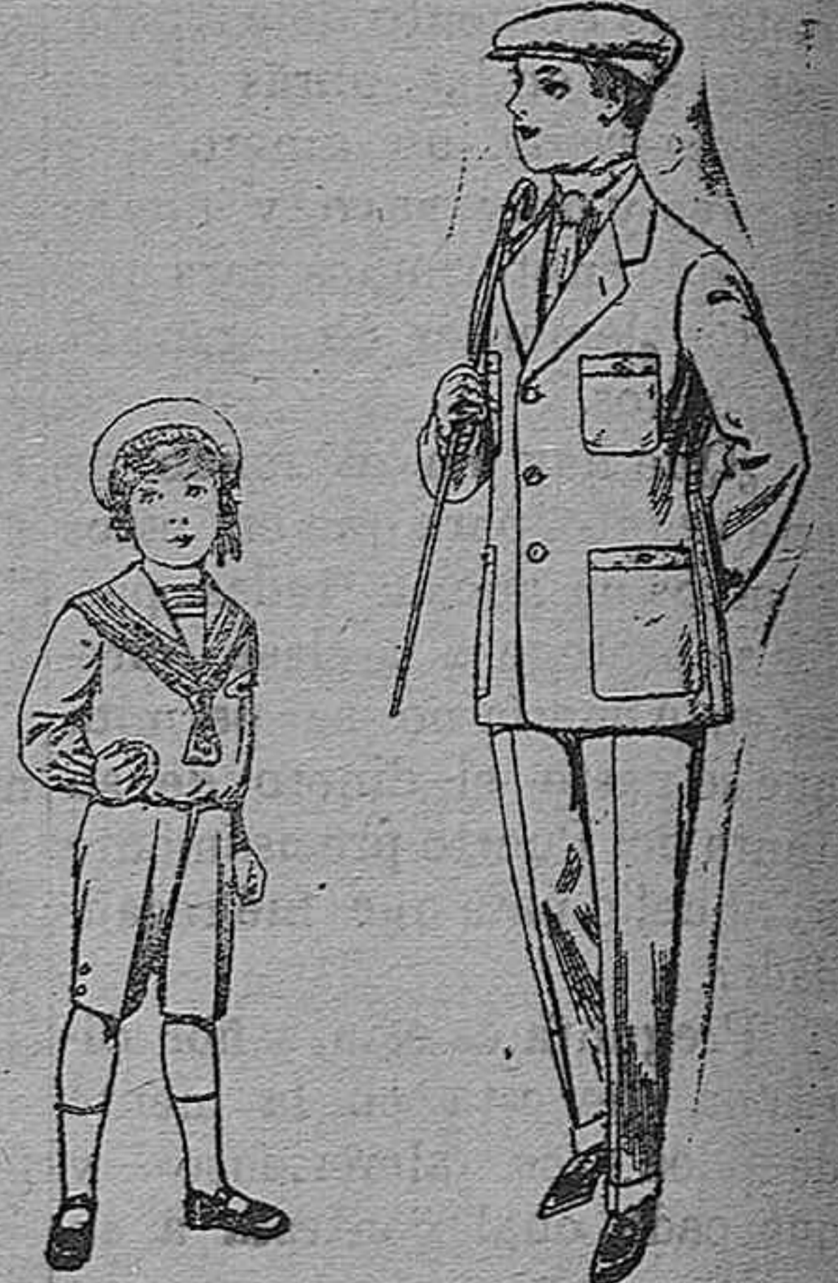
Trajes marinera de vicuña azul, para niños de 4 á 9 años. Pt. 6:20 Trajes modelo Sport de dril listado para jovencitos de 10 a 16 años. De pesetas 11 a 17

Gran exposición de artículos para la temporada