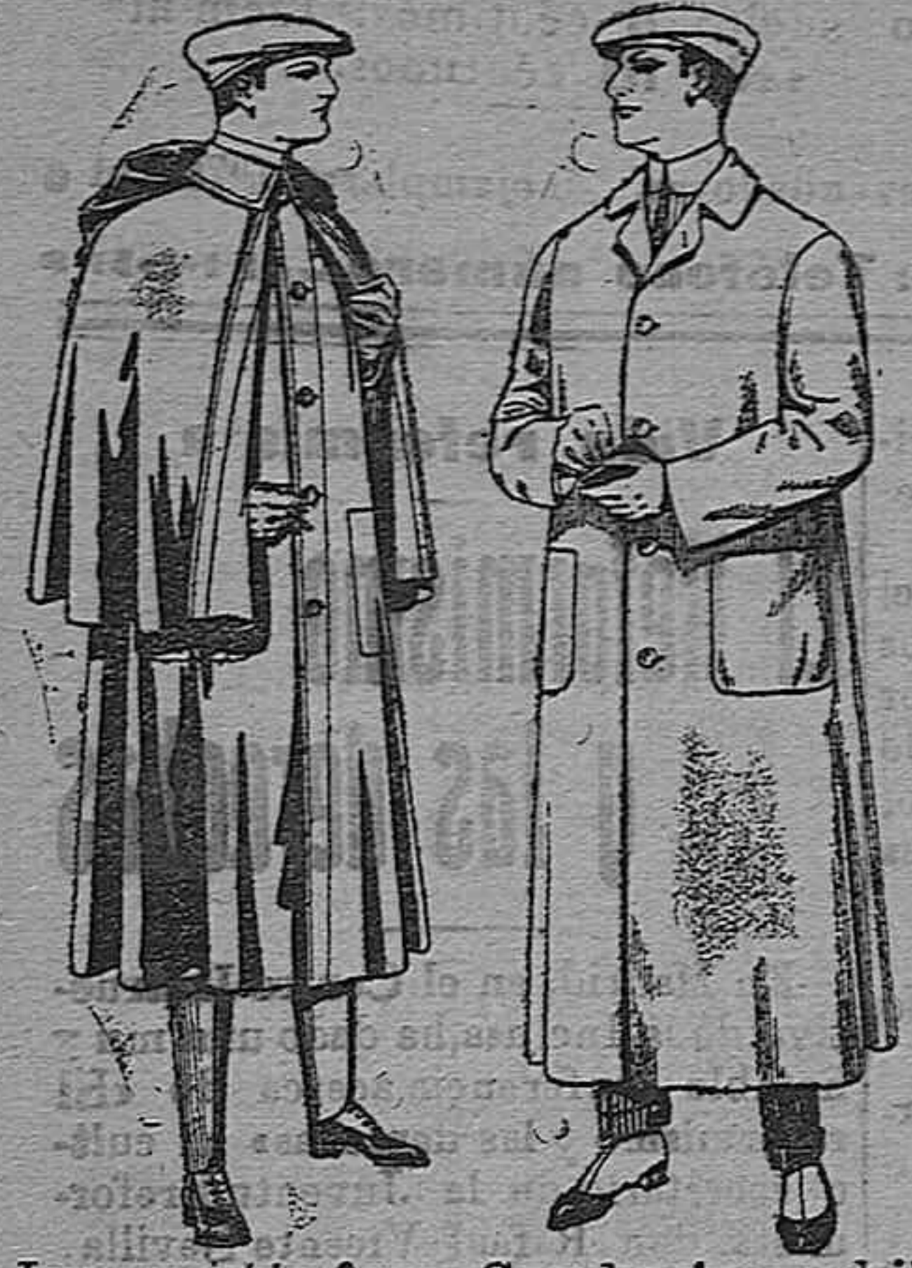
Impermeables forma Guardapolvos de dril moackferland en negro y azul De pesetas 55 á 100 De pesetas 6 á 11