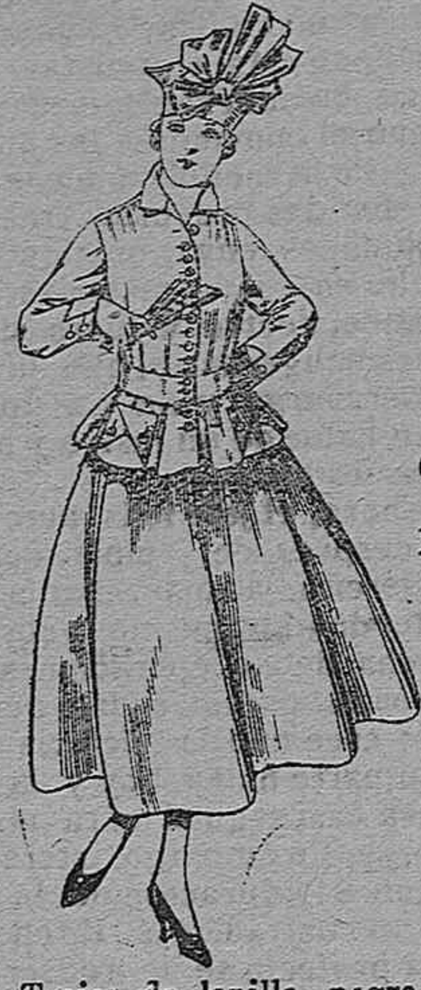
Trajes de lanilla negra, azul y color A pesetas 70