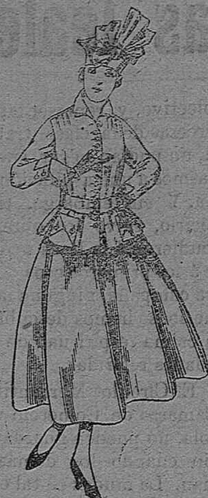
Trajes de lanilla negra, azul y color A pesetas 70