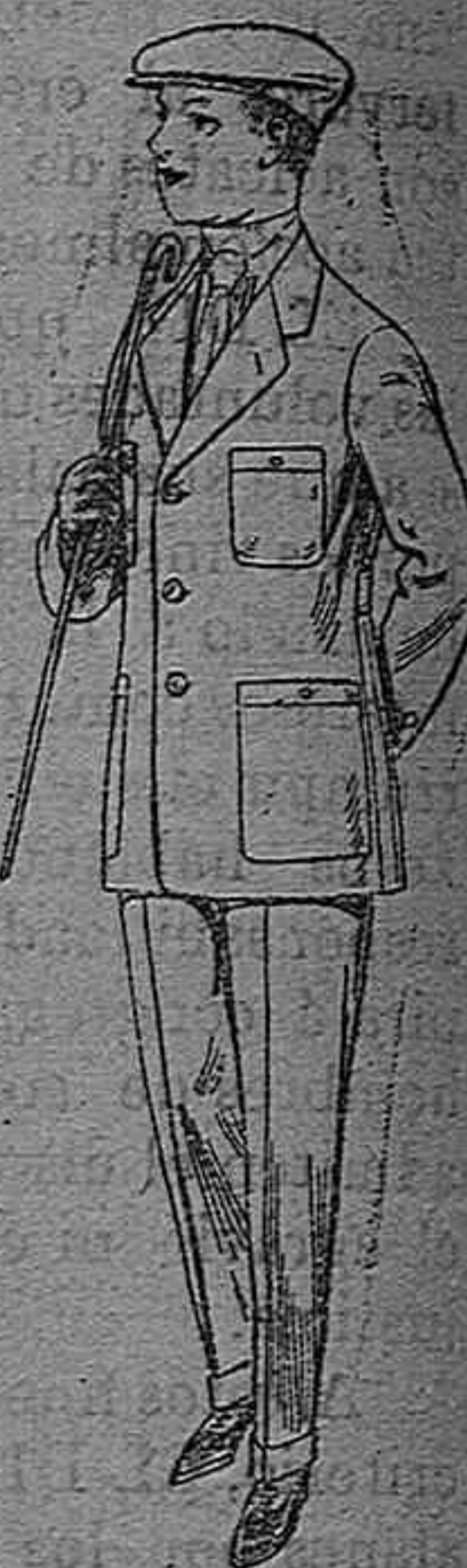
Trajes modelo Sport de dril listado para jovencitos de 10 á 16 años. De pesetas 11 á 17