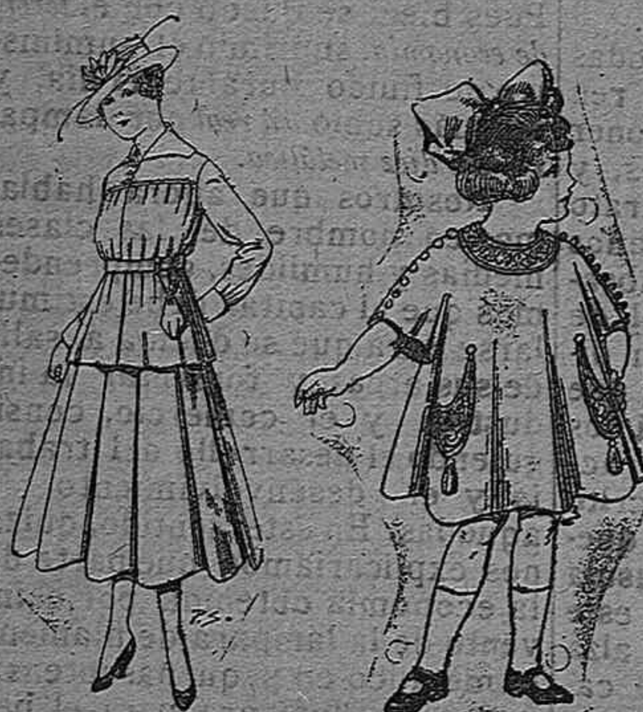
Trajes de lanilla Vestidos de lanilla para para jovencitas de niñas de 4 á 9 años 13 á 19. Pt. 50 á 55 De pesetas 30 á 38