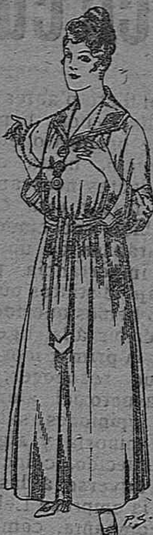
Bata de crepón color, cuello bordado De pesetas 6 á 11