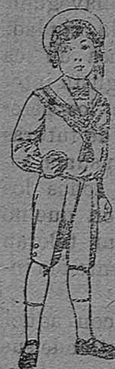
Trajes marineros de vicuña azul, para niños de 4 á 9 años. Pt. 6 á 20