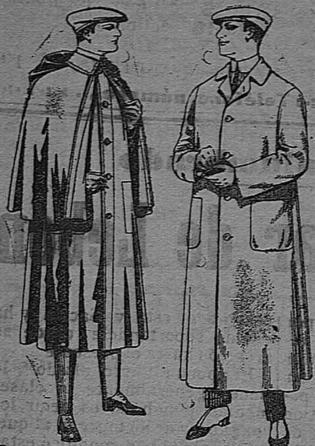
Impermeables forma Guardapolvos de dril mackferland en negro y azul De pesetas 55 á 100 De pesetas 6 á 11

Gran exposición de artículos para la temporada