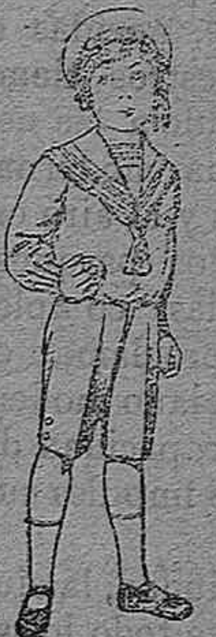
Trajes marineros de vicuña azul, para niños de 4 á 9 años. Pt. 6 á 20