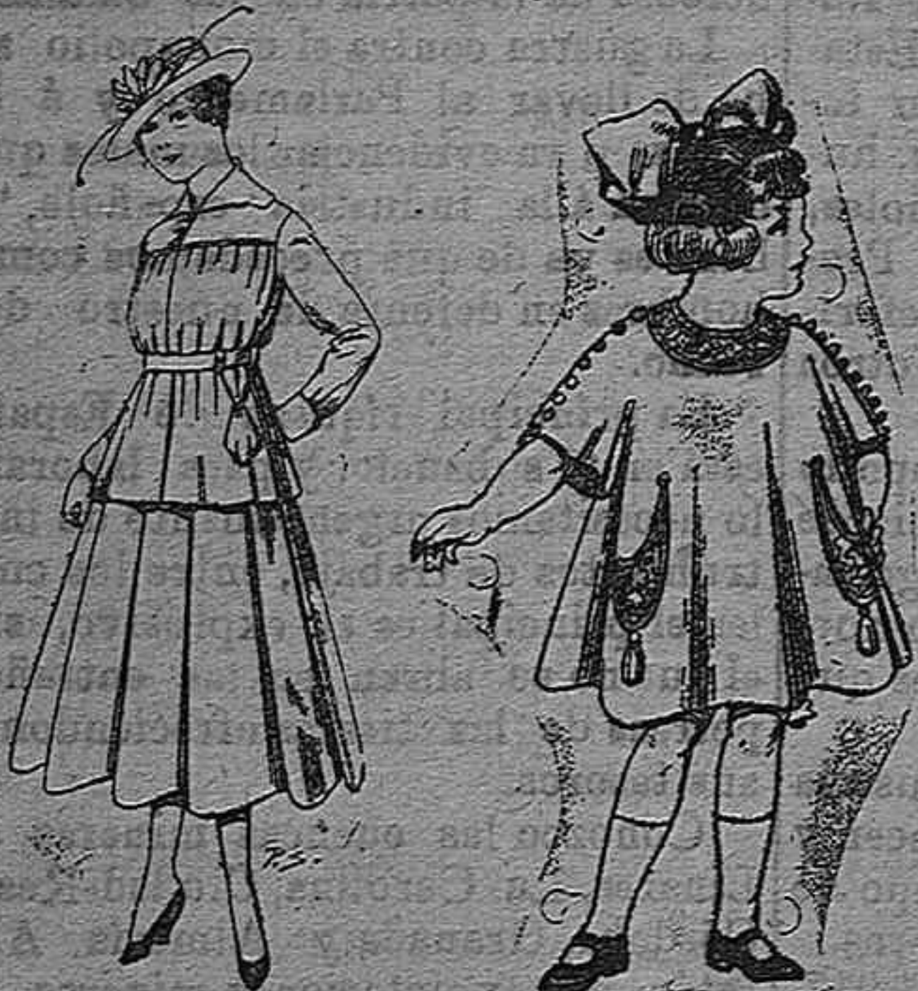
Trajes de lanilla bastidos de lanilla para niñas de 4 á 9 años De pesetas 30 á 38