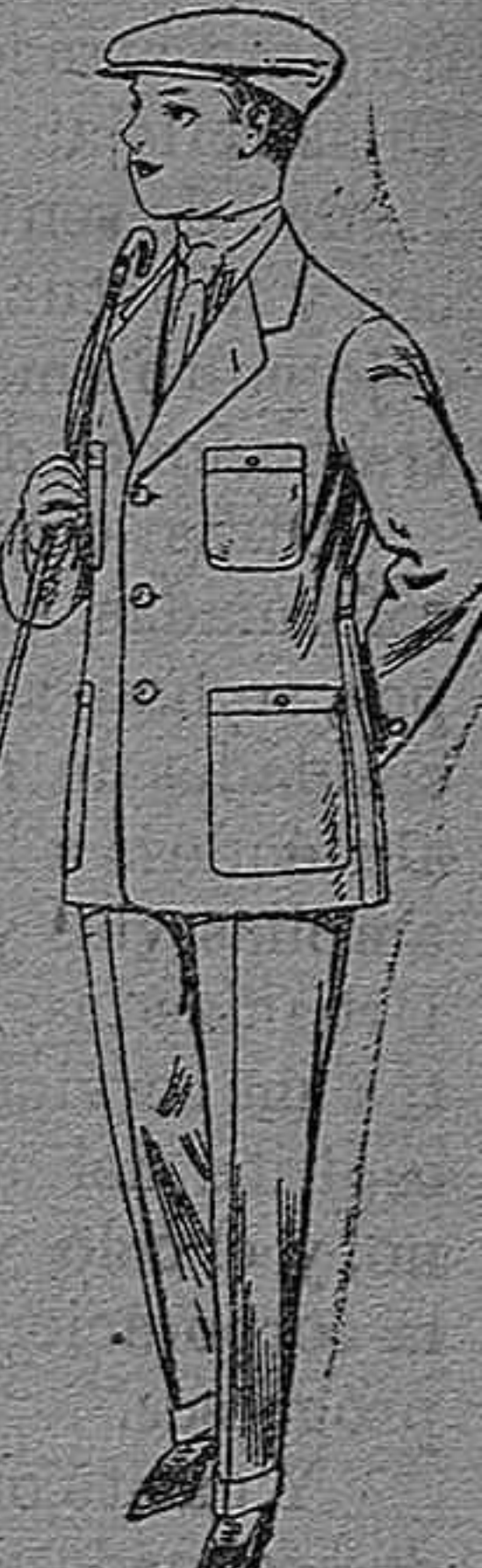
Trajes modelo Sport de dril listado para jovencitos de 10 á 16 años. De pesetas 11 á 17