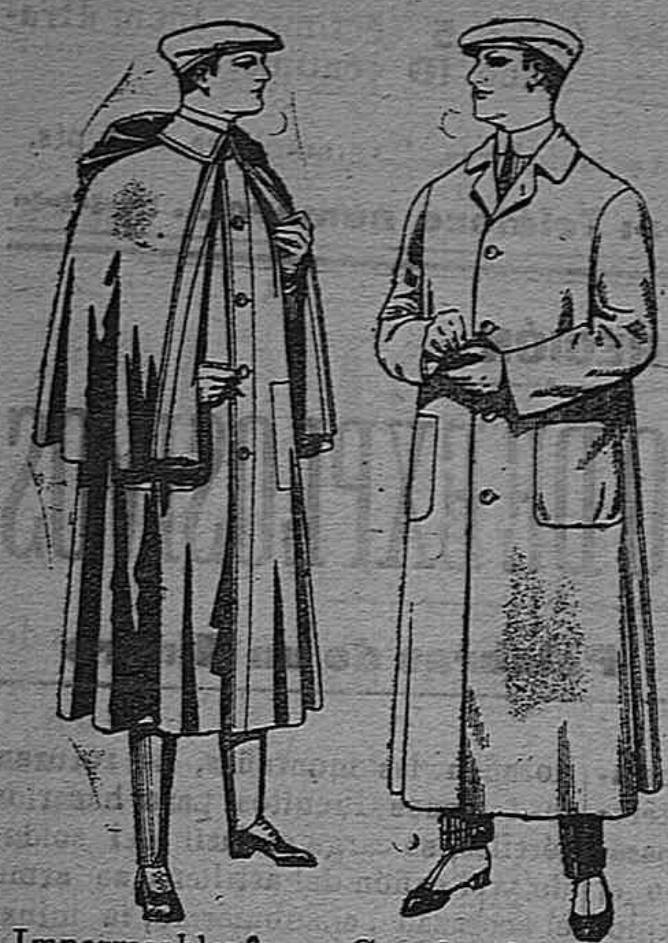
Impermeables forma Guardapolvos de dril mackferland en negro y azul De pesetas 55 á 100 De pesetas 6 á 11

Gran exposición de artículos para la temporada