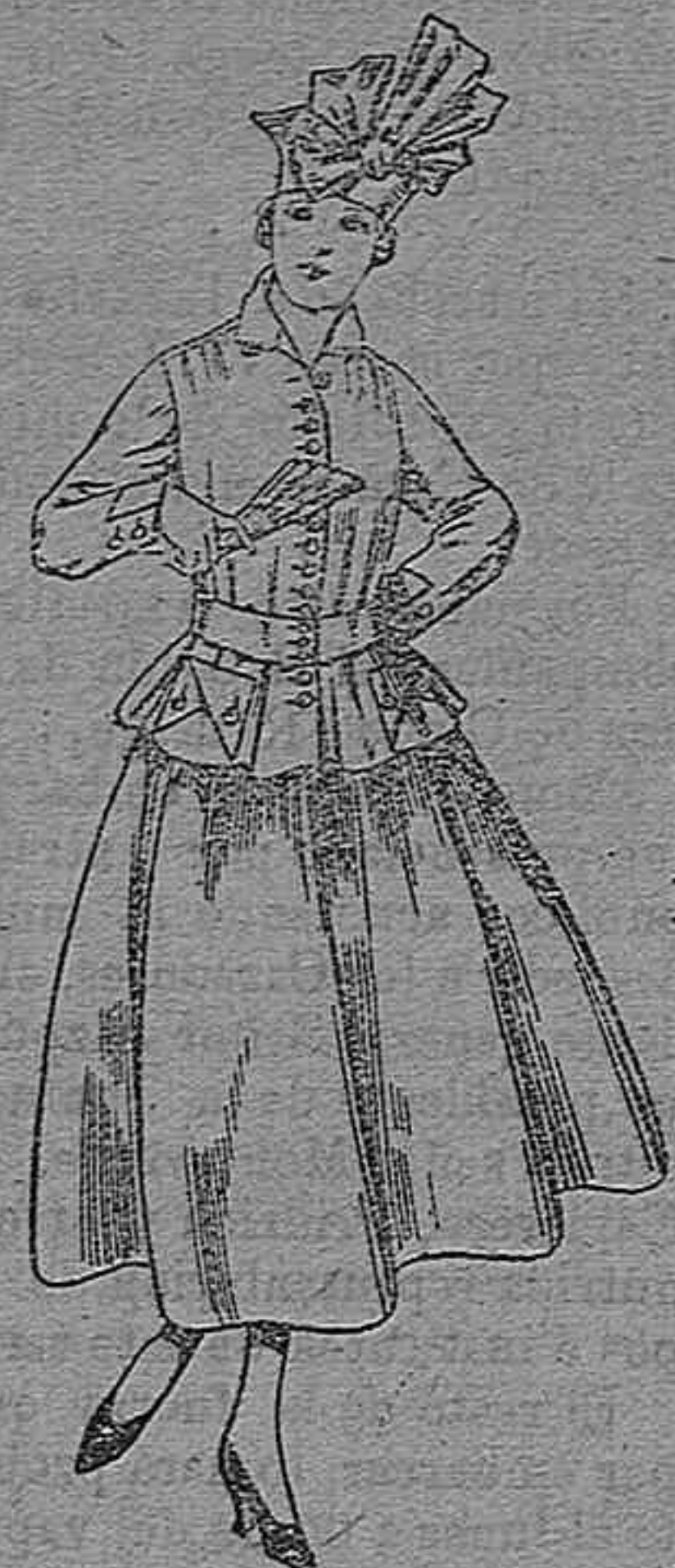
Trajes de lanilla negra, azul y color A pesetas 70