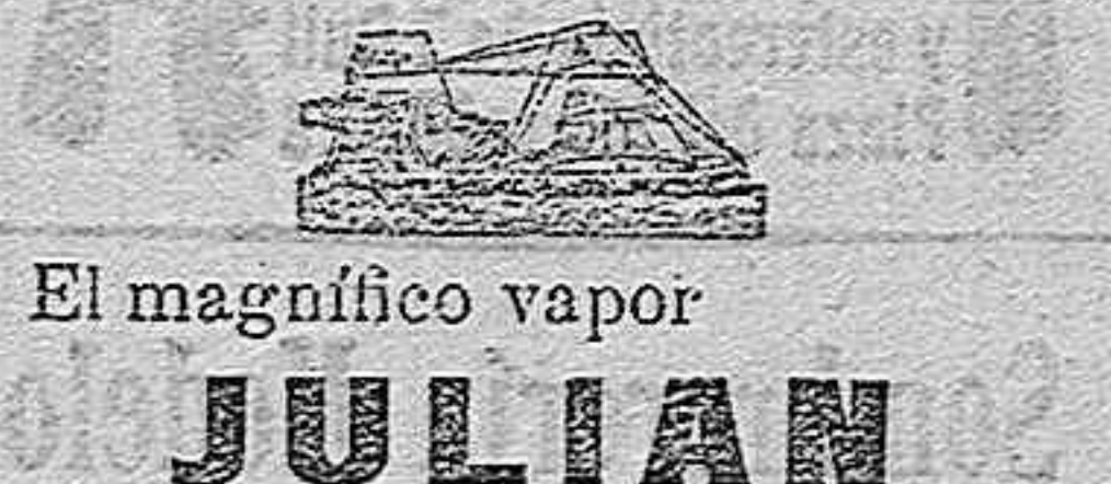
El magnífico vapor

El arrendatario de las patentes ha querido cobrar a rechina botón a los drogueros, más de lo que éstos, por la buena, se hallaban dispuestos a pagar; y ahora se encuentra metido en un berengenal, del que ya veremos cómo sale. Hay cosas que no conviene extremar, y ni a los industriales ni a nadie deben apretárseles tanto los tornillos, que se les haga saltar de mala manera.