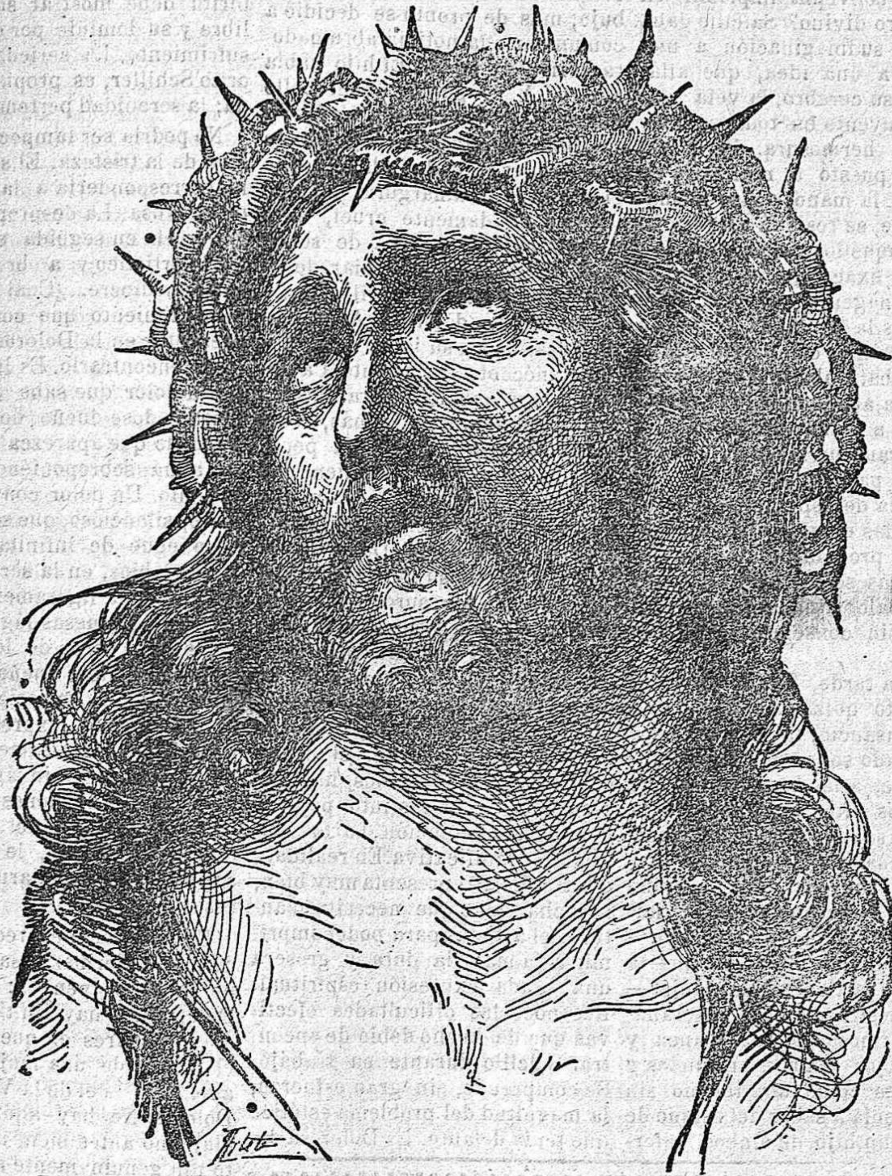
ECCE HOMO (Cuadro de Guido Renu)