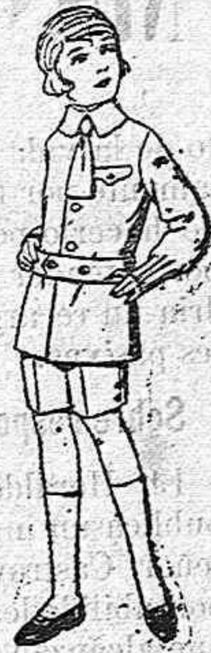
Trajes de lanilla, melton, etc. para niños de 4 a 9 años de pts. 15 a 25. Los mismos de dril liso o listado de pts. 11 a 18.