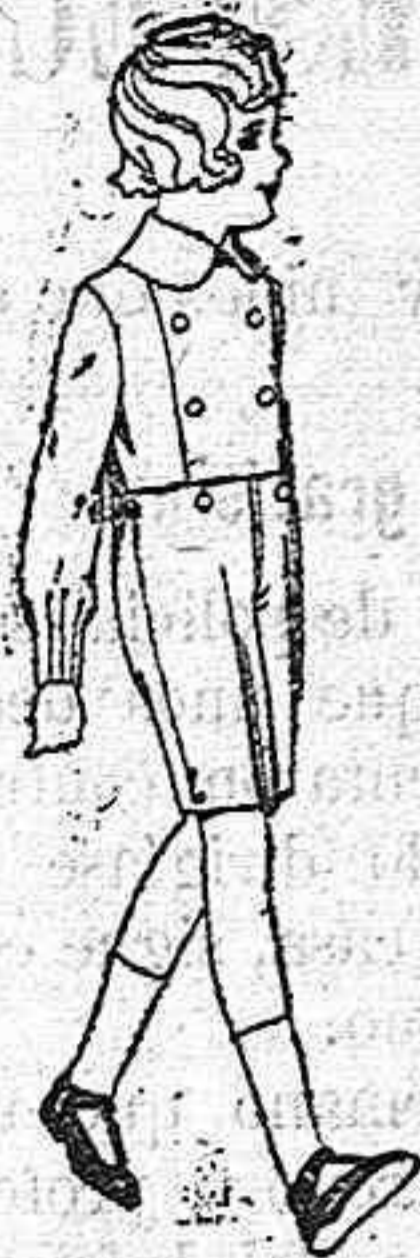
Trajes de vicuña azul e estambre gris para grooms de 10 a 15 años de pts. 45 a 80. Los mismos con pantalón breeches de pts. 47 a 80.