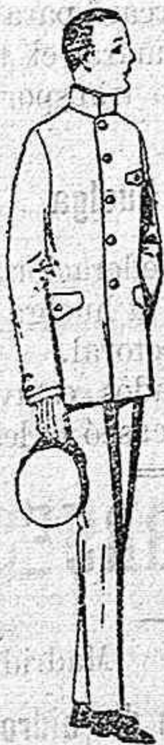
Trajes de vicuña azul o estambre gris, para grooms de 10 a 15 años de pts. 45 a 80. Los mismos con pantalón breeches de pts. 47 a 80