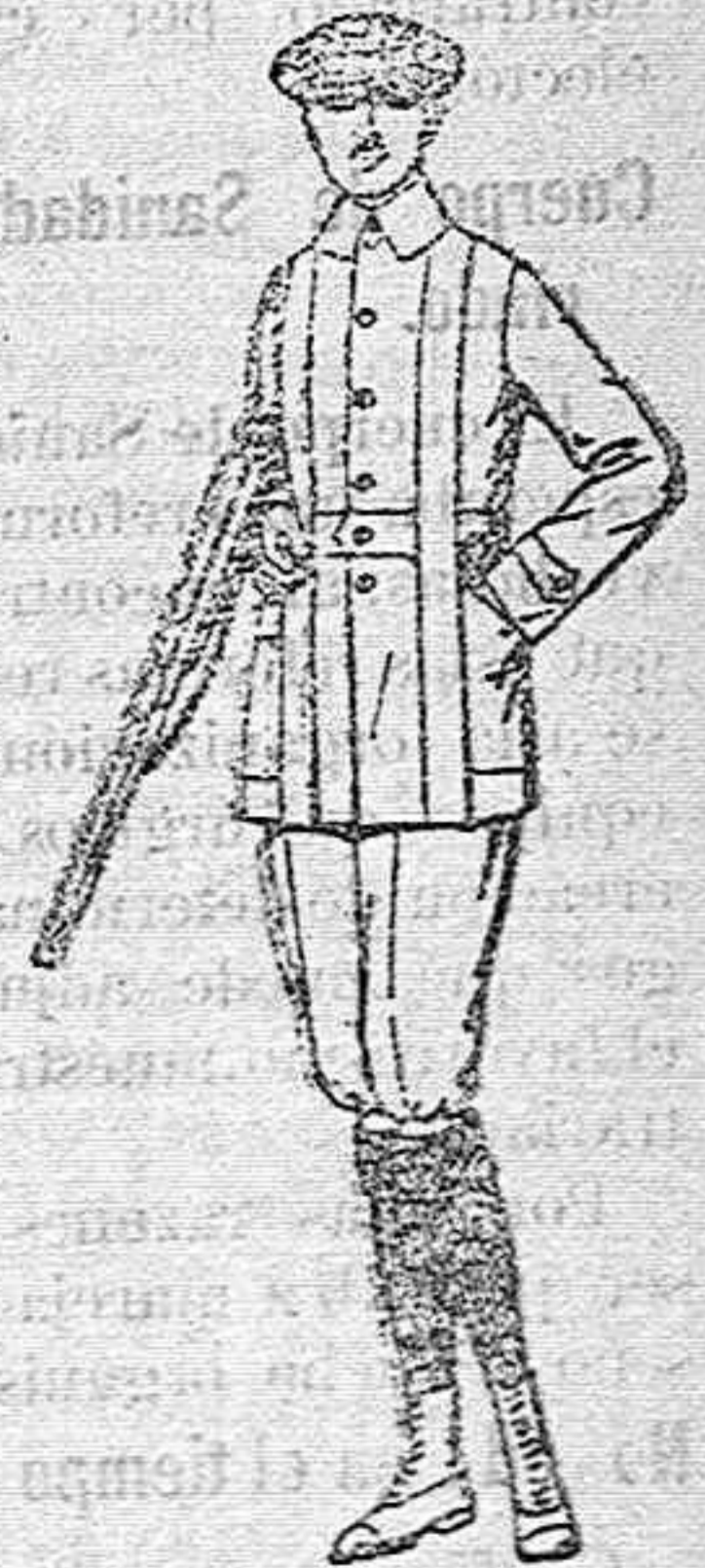
Cazadoras de dril crudo o kaki de pts. 25 a 25. Pantalones cortos, para excursionistas, de dril, belge o gris de pts. 10 a 18

Precio fijo---Pidase el catálogo general---Ventas al contado