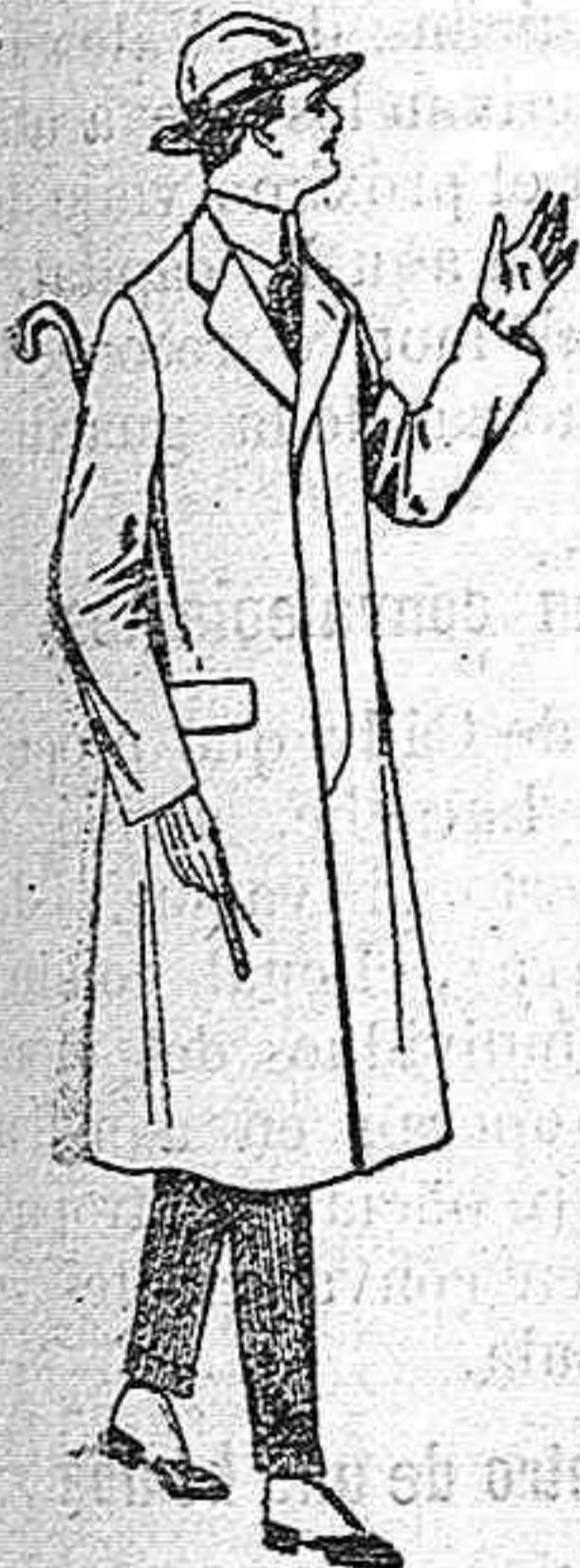
Gabanes de cheviot melton, etc. con forro de seda o satén de ptas. 60 a 160