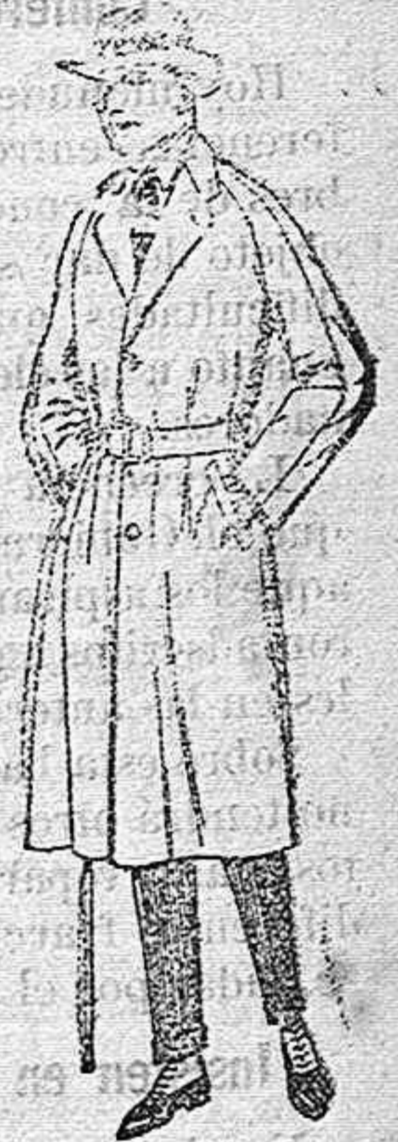
Gabanes de cheviot, cover, melton, gabardina etc. de pts. 80 a 185. Grances existencias en géneros para gabanes a medida