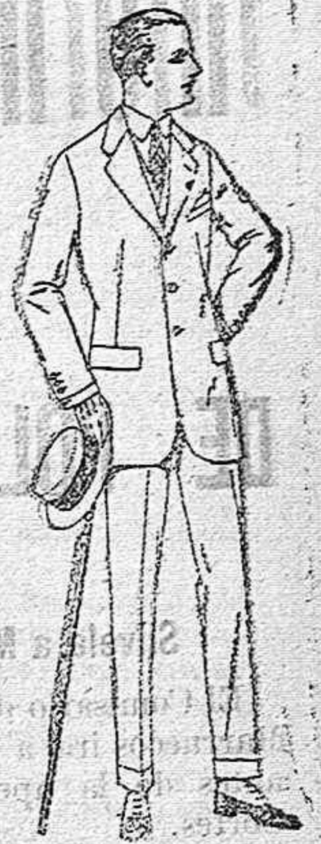
Trajes de lanilla, melton, estambre, vicuña o jerga de pts. 29 a 125. Trajes de dril crudo, kaki o listado de pts. 28 a 60.