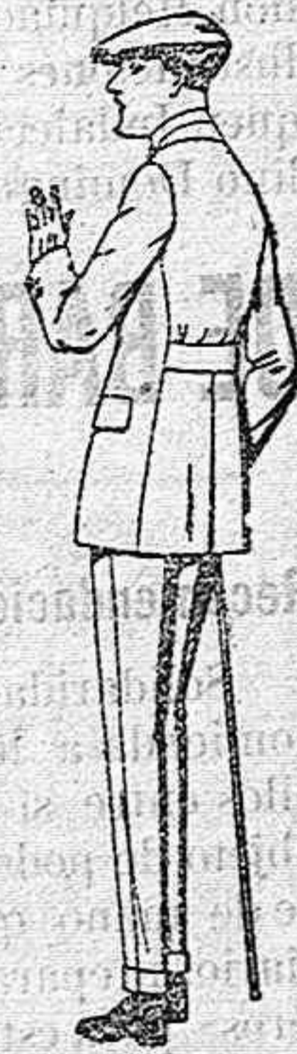
Trajes modelo Sport, de lanilla, melton etc. para jovencitos de 10 a 16 años de pts. 27 a 85. El mismo modelo en dril listado, crudo o kaki de pts. 25 a 42