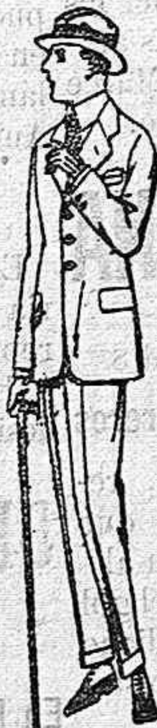
Trajes de lanilla, vicuña o estambre, para jovencitos de 10 a 16 años de pts. 26 a 80. Trajes de dril crudo o kaki de pts. 23 a 40