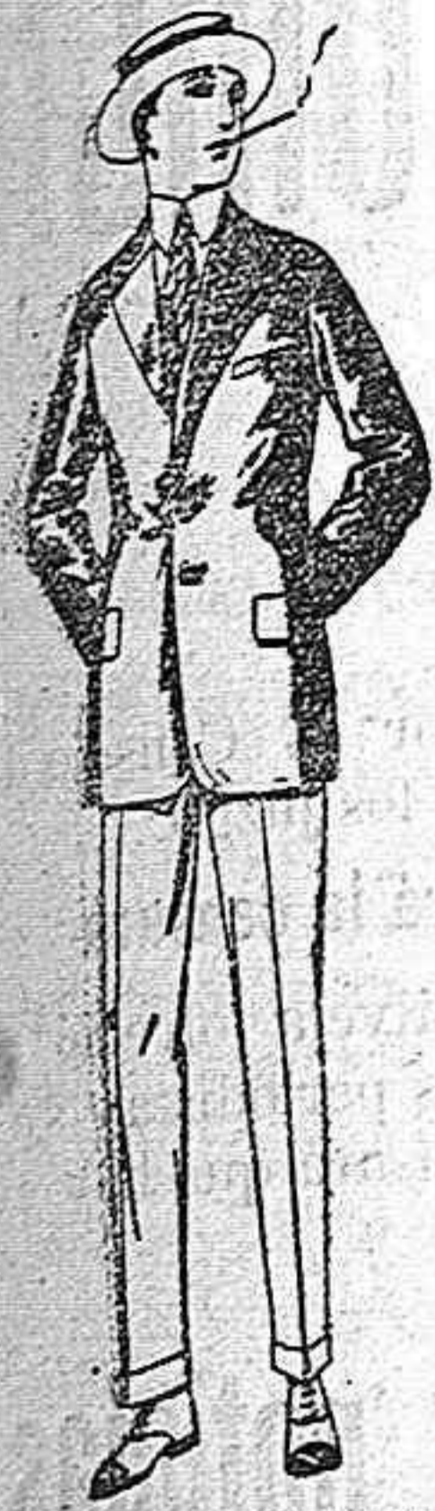
Trajes de alpaca negra o azul de pts. 80 a 115. Americanas de alpaca negra o azul de pts. 40 a 70. Pantalones de dril liso o listado de pesetas 10 a 18.

Madrid, Barcelona, Alicante, Bilbao, Cádiz, Cartagena, Gijón, Granada, Málaga, Palma de Mallorca, Santander, Sevilla, Valencia, Valladolid, Zaragoza