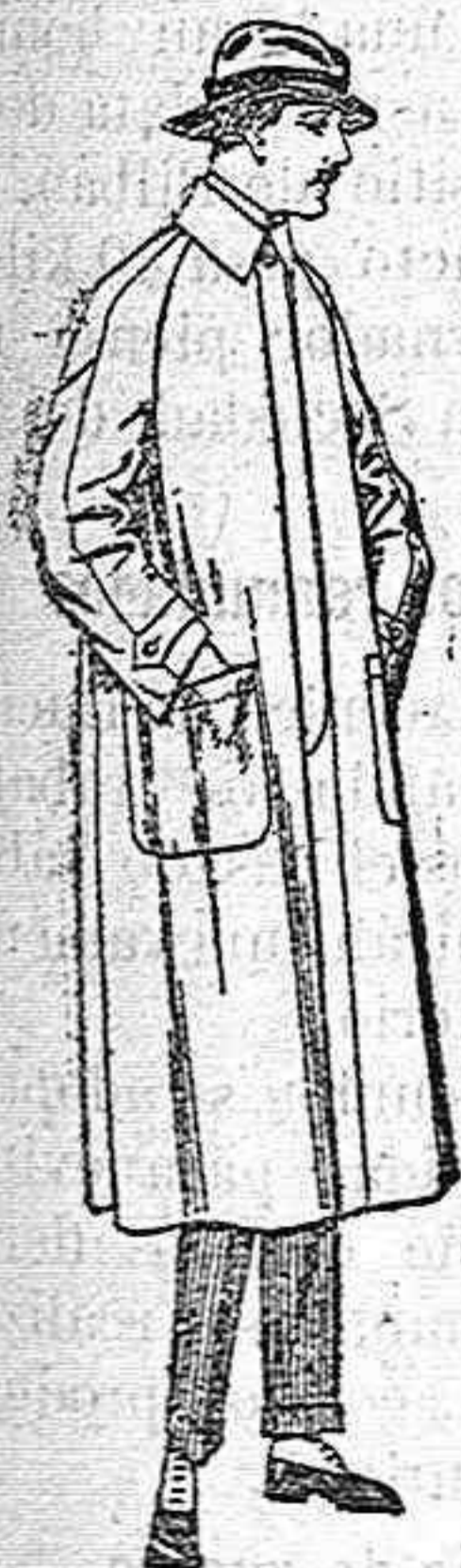
Impermeables forma gabán, raglán de pts. 40 a 170. El mismo modelo en caoutchouc negro de pts. 70 a 90

Ropas confeccionadas para caballero, señora, niño y niña