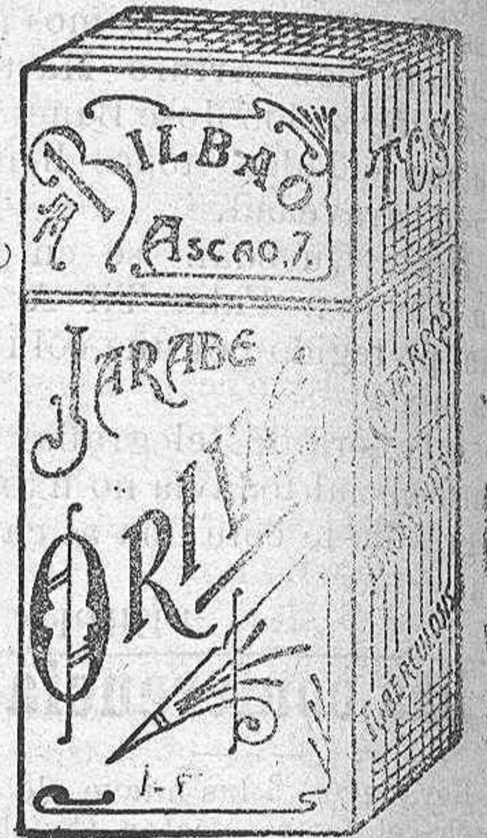
FL. M. remedio contra el PEOS catarro. Jarabe Orive.