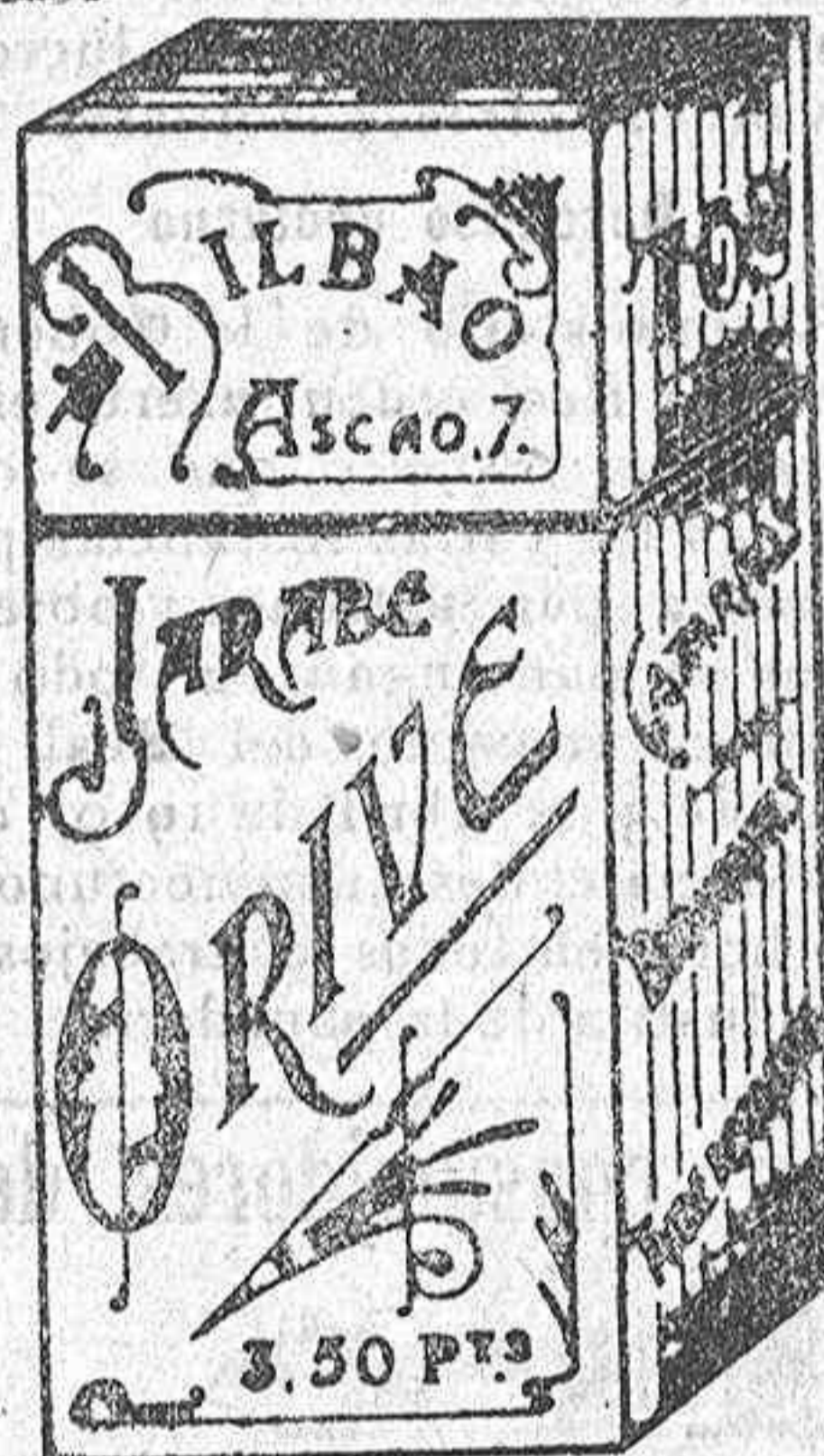
Los infalibles resultados del JARABE de ORIVE, no se hacen esperar en la curación de la tos, catarros, bronquitis etc.

Pedidos en todos los Ultramarinos y Confeiterías