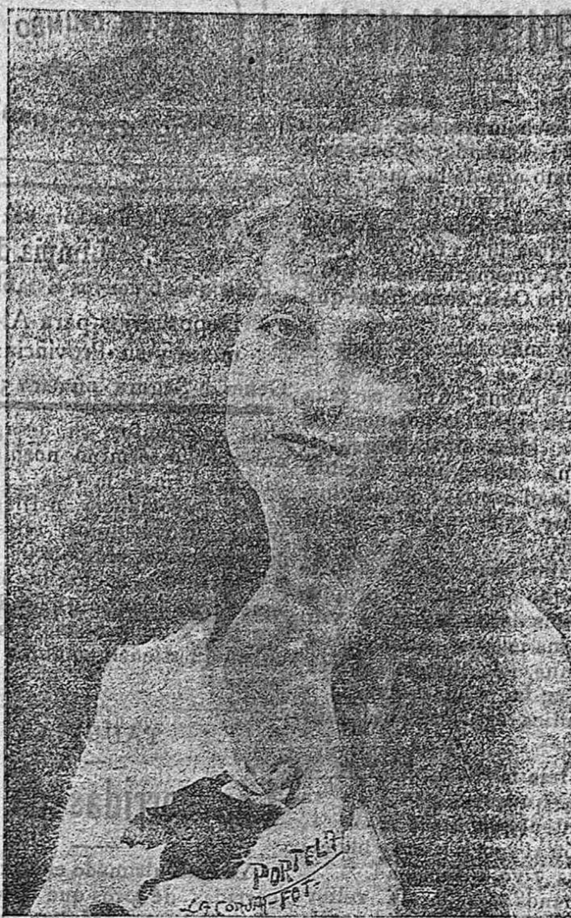
Segunda presentación de la bellisima cupletista