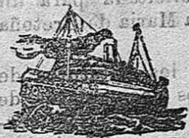
El tan conocido vapor

La verdad es, dirán muchos, que para un desenlace tan tonto y rápido, no merecía haber tomado delantera de paraiso. Tan ricamente como pensaron pasarlo muchos con el desfile de testigos, la incautación de la herencia.