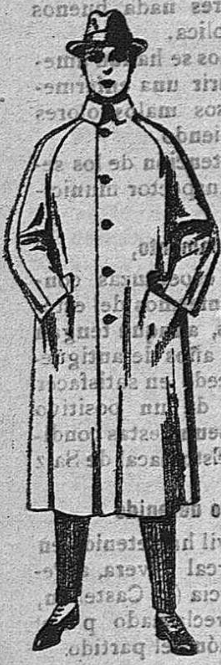
Gabanes de patén, chevrolet o cover de pesetas 70 a 150.