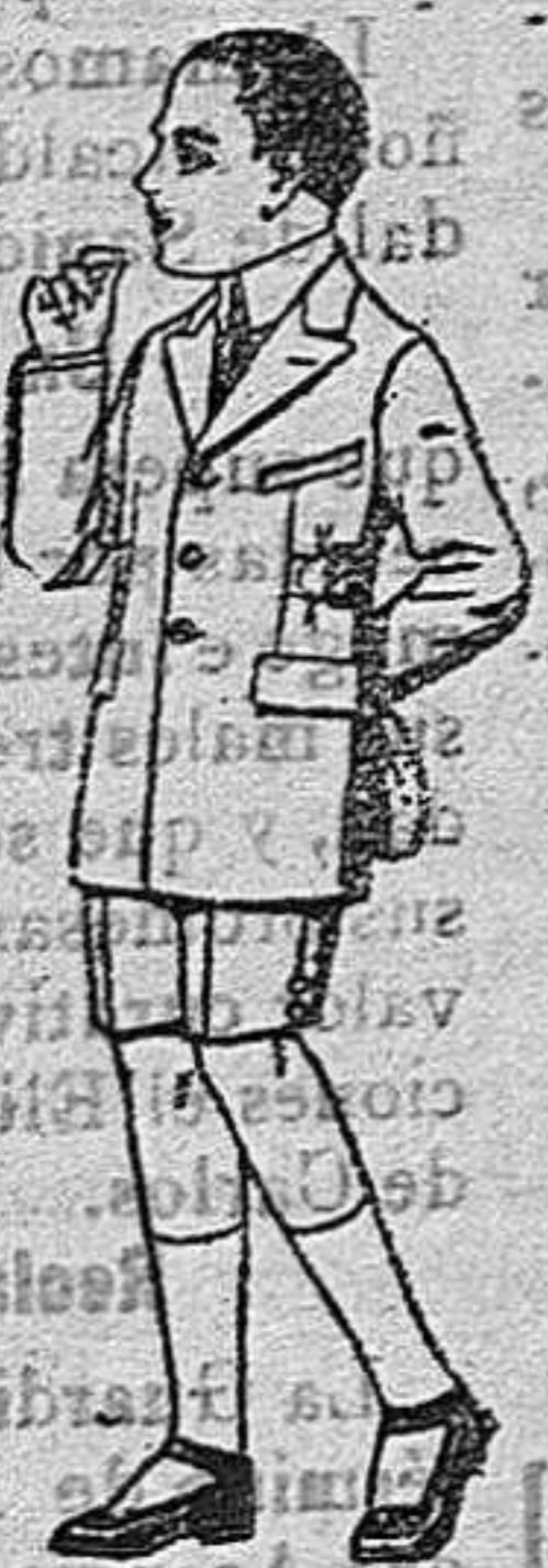
Trajes modelo Sport, de lanilla, estambre, melton, etc., para niños de 7 a 12 años. de ptas. 28 a 50.

Ropas confeccionadas para Caballero, Señora, Niño y Niña