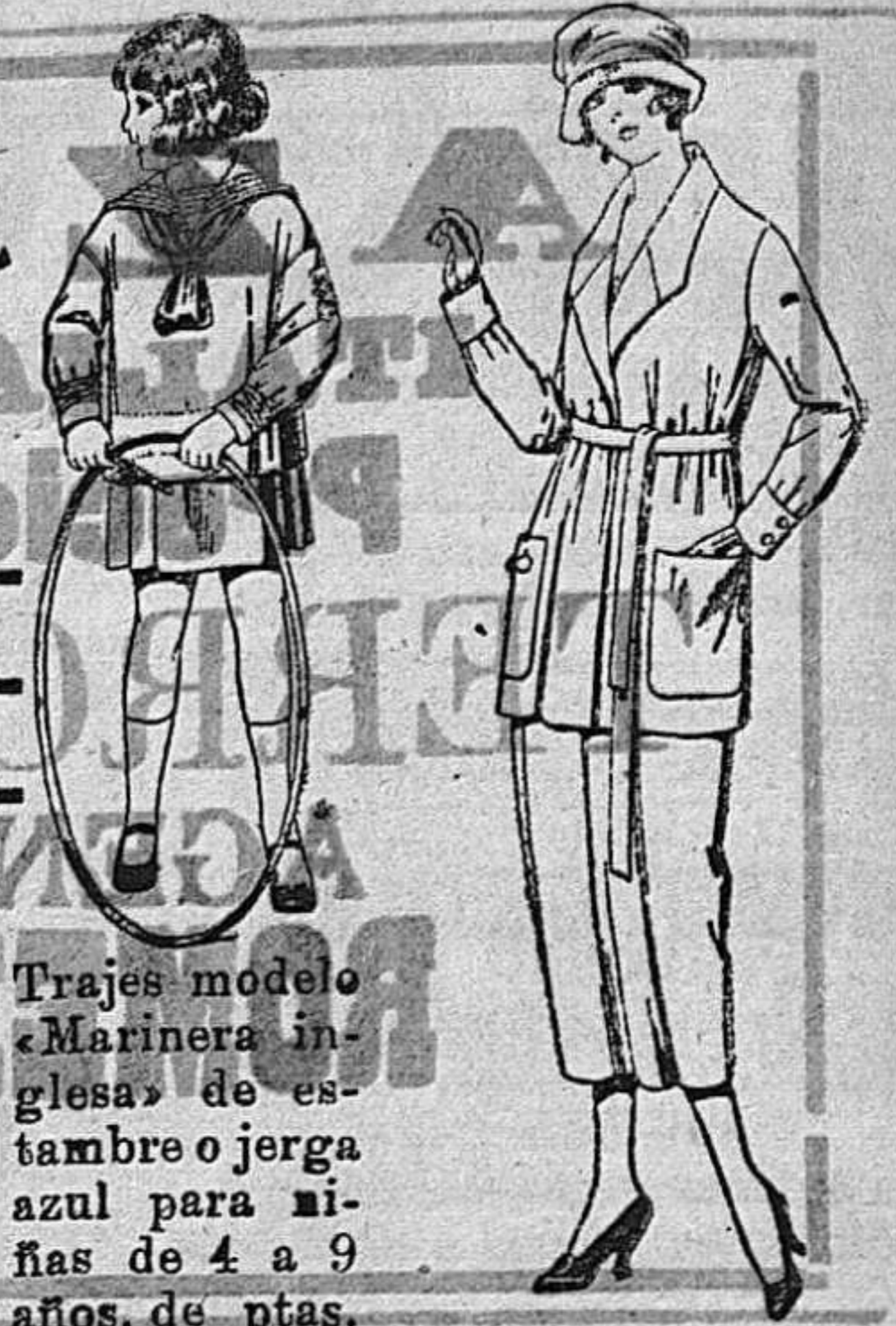
Trajes modelo «Marinera inglesa» de estambre o jerga azul para niñas de 4 a 9 años, de ptas. 30 a 42.