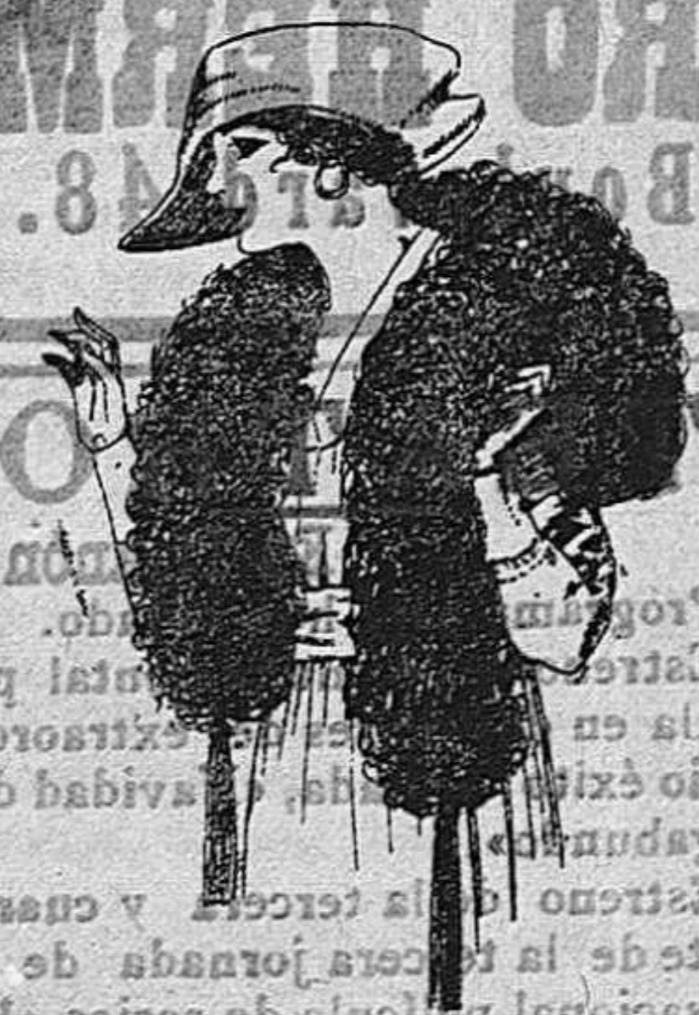
Boa de pluma de avestruz, en negro, blanco, café y gris etc. de ptas. 32 a 70.