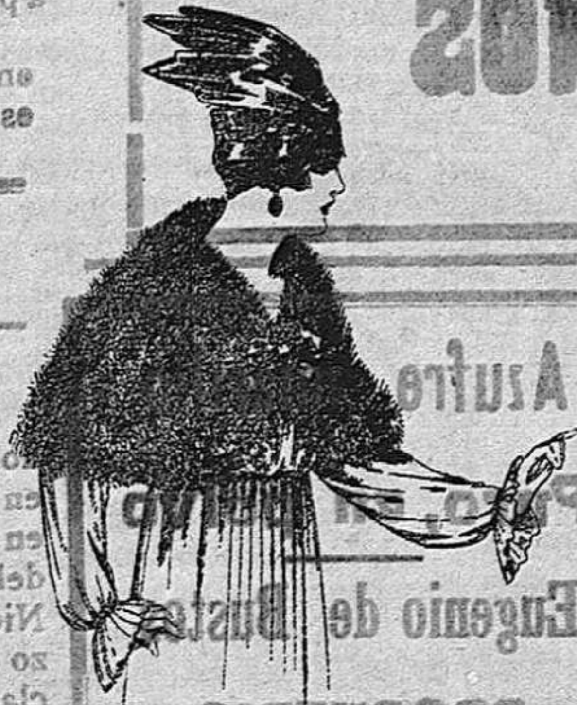
Capelinas de marabú adornadas, con cinta y forro seda ptas. 32 a 40