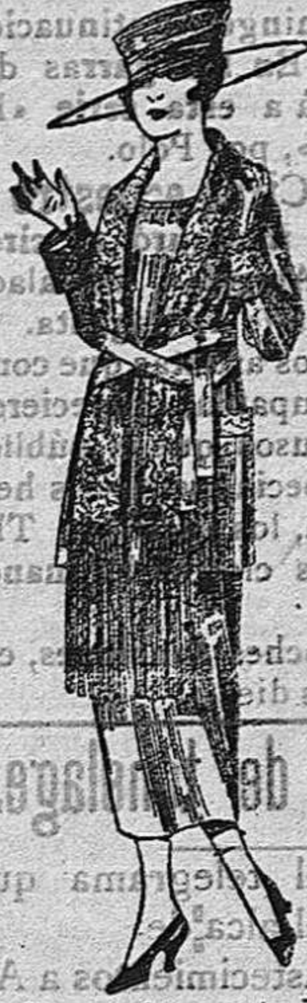
Paletots de punto de lana, cuello bufanda de ptas. 50 a 59.

Zapatería Paraguas Bastones Peletería y Artículos de Viaje.