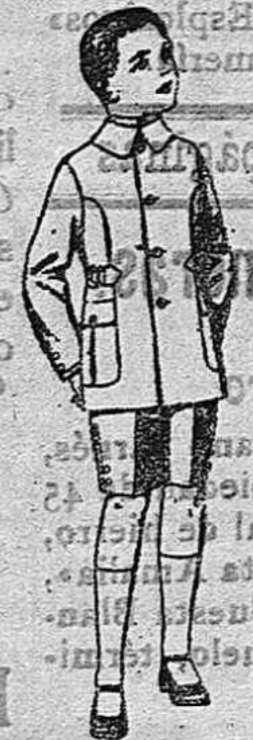
Trajes modelo Sport, de lanilla, etc., para niños de 4 a 9 años de peseta cinturón de ptas. 25 a 48.