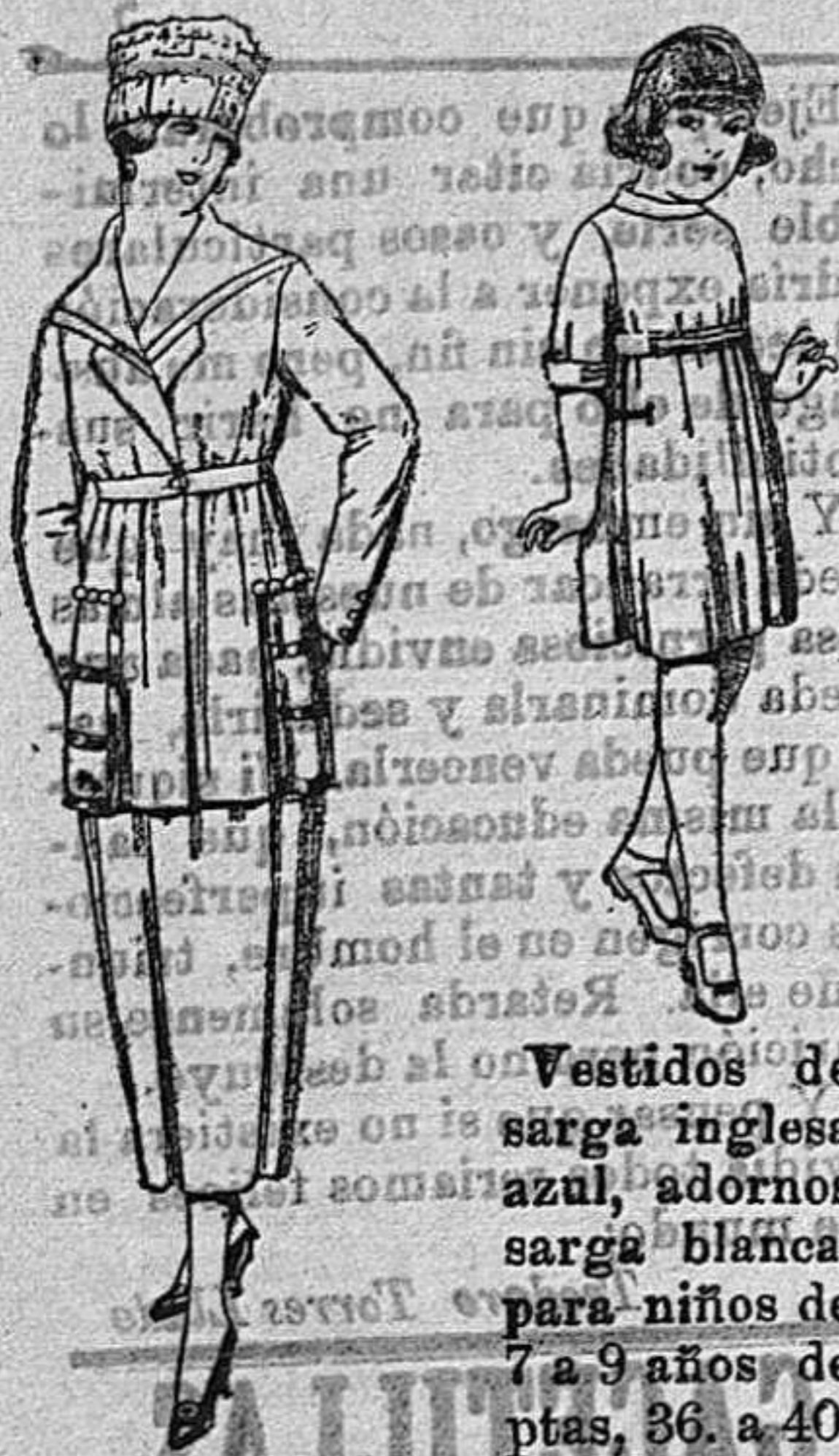
Vestidos de sarga inglesa azul, adornos sarga blanca, para niños de 7 a 9 años de ptas. 36. a 40.

SUCURSALES: Madrid, Barcelona, Alicante, Bilbao, Cádiz, Cartagena, Gijón, Granada, Málaga, Palma de Mallorca, Santander, Sevilla, Valencia, Valladolid, Zaragoza.