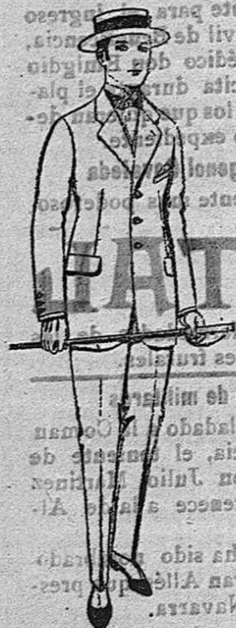
Trajes de lanilla, melton, estambre vienna o jerga ptas. 28 a 115.

Camisera General de punto. Corbatería. Guantería, Sombrerería.