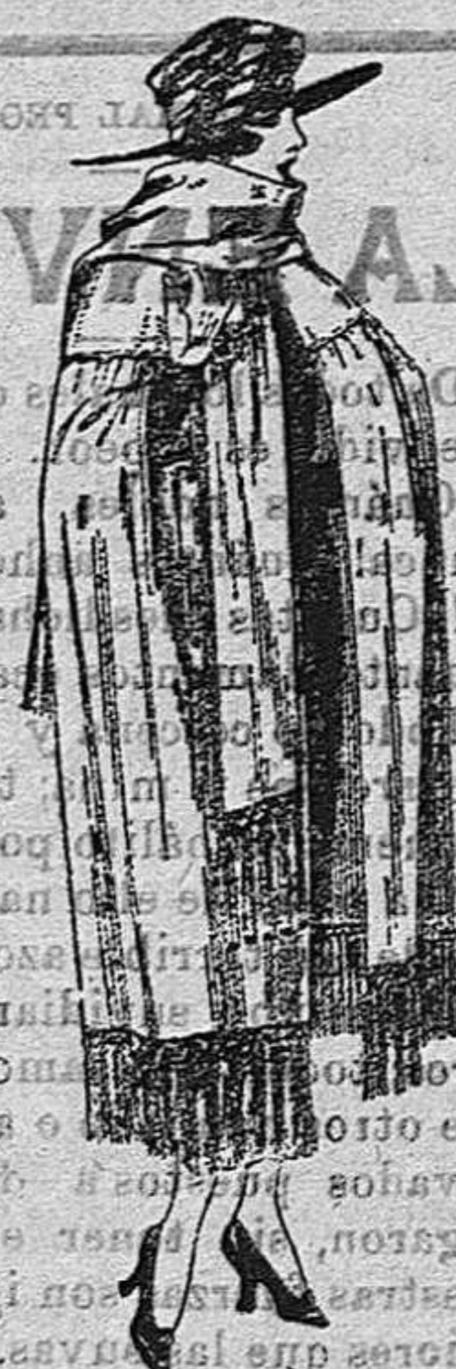
Capas de gabardina inglesa, diferentes colores a ptas. 130.

Camisera General de punto. Corbatería. Guantería, Sombrerería.