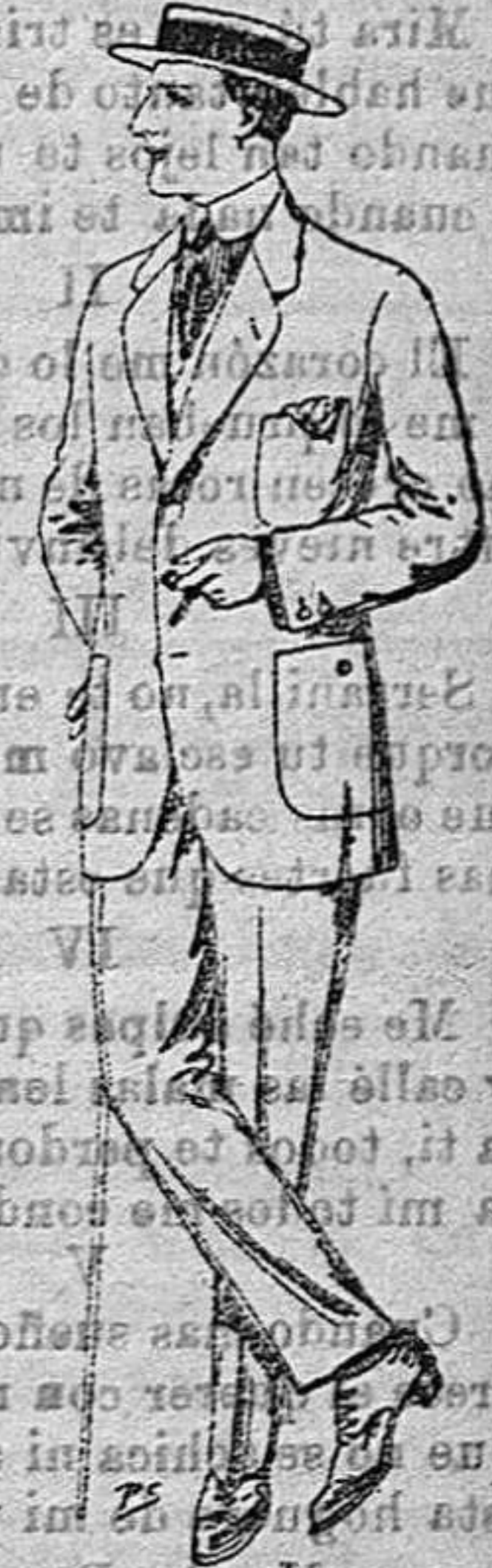
Trajes de dril crudo, kaki o listado. de ptas. 17 a 48.

Zapatería Paraguas Bastones Peletería y Artículos de Viaje.