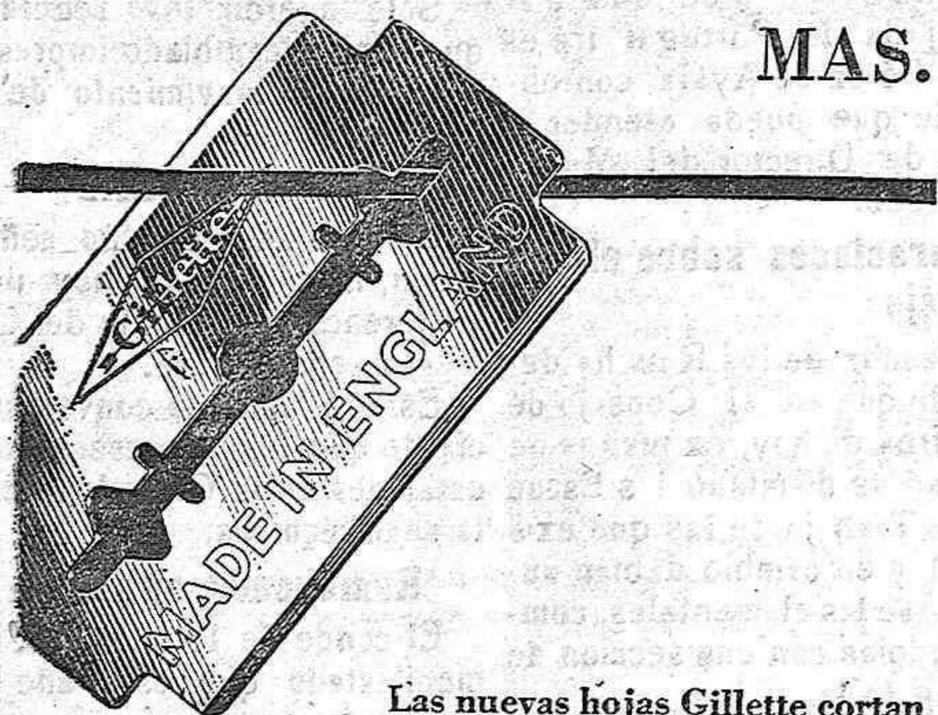
Las nuevas hojas se distinguen por la frase "Made in England" que se lee en la envoltura.