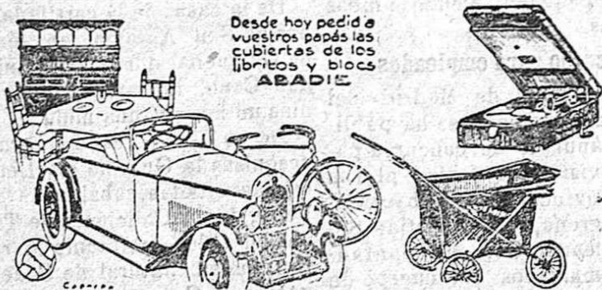
Desde hoy pedid a vuestros papás las cubiertas de los libritos y blocs ABADIE

El papel de fumar ABADIE va a celebrar otro REGALO DE JUGUETES como el que tanto éxito tuvo en el año anterior