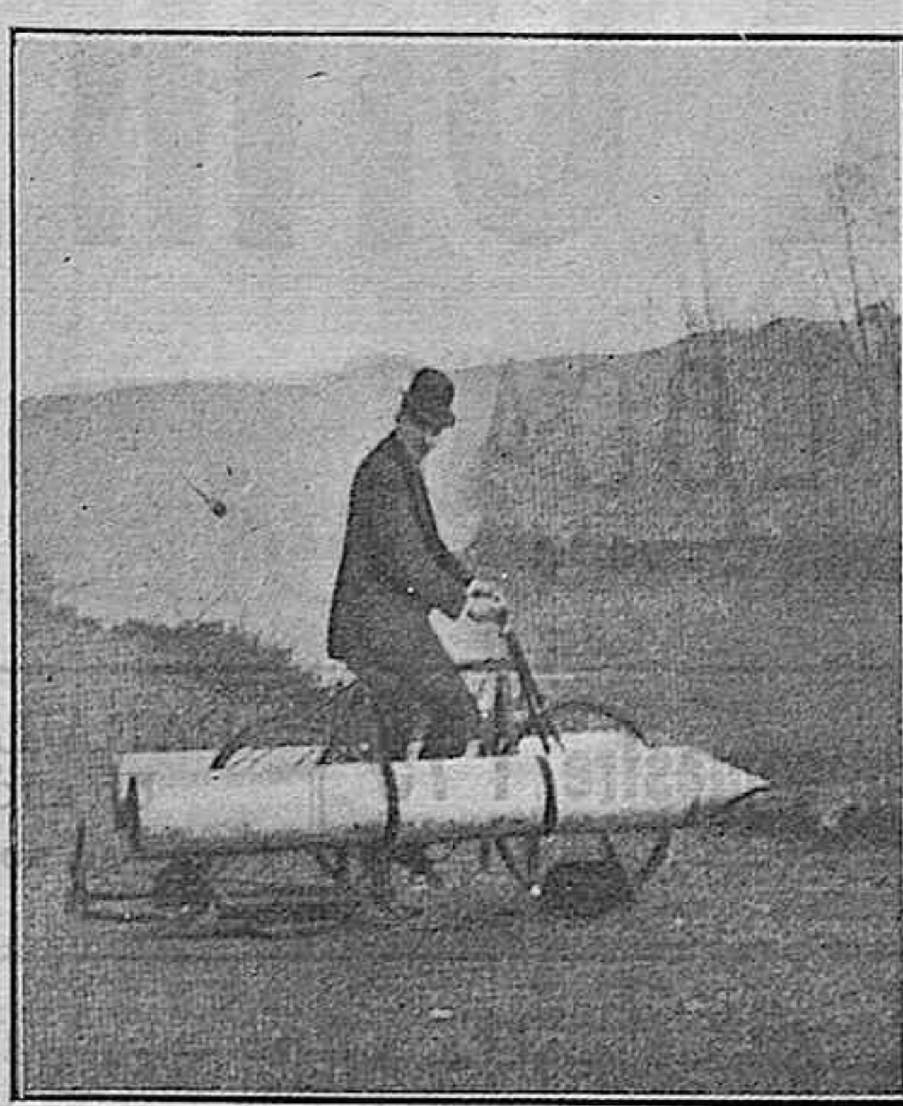
El amphibicycle ó bicicleta que permite andar por tierra firme y por encima del agua

Y á estos polvos, íntimamente mezclados, se les añade: