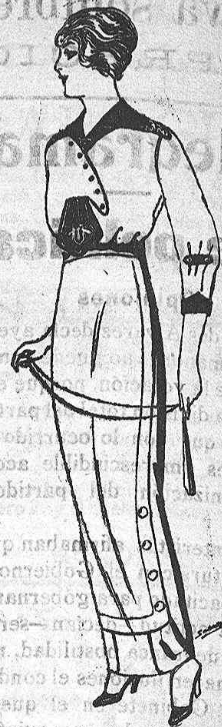
Blusa de seda blanca y colores, adornos borda- dos de Ptas. 25. Faldas de lana de ptas. 11 á 22

Princesa, 2 ALICANTE Victoria, 1 SUCURSALES: