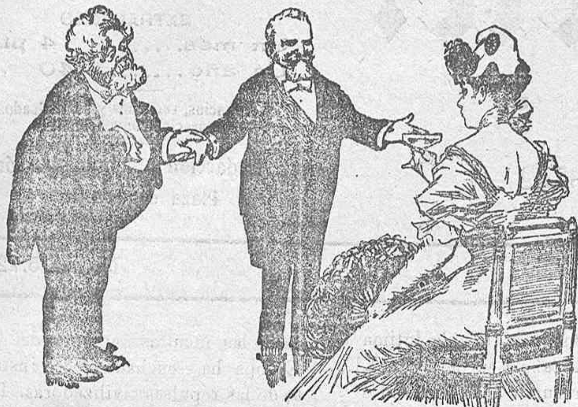
Fallieres. Loubet. —Voyme á casa satisfecho, Fallieres mantendrá la paz. —Es pancista es vinatero, ¿Quién sabe si acertará!