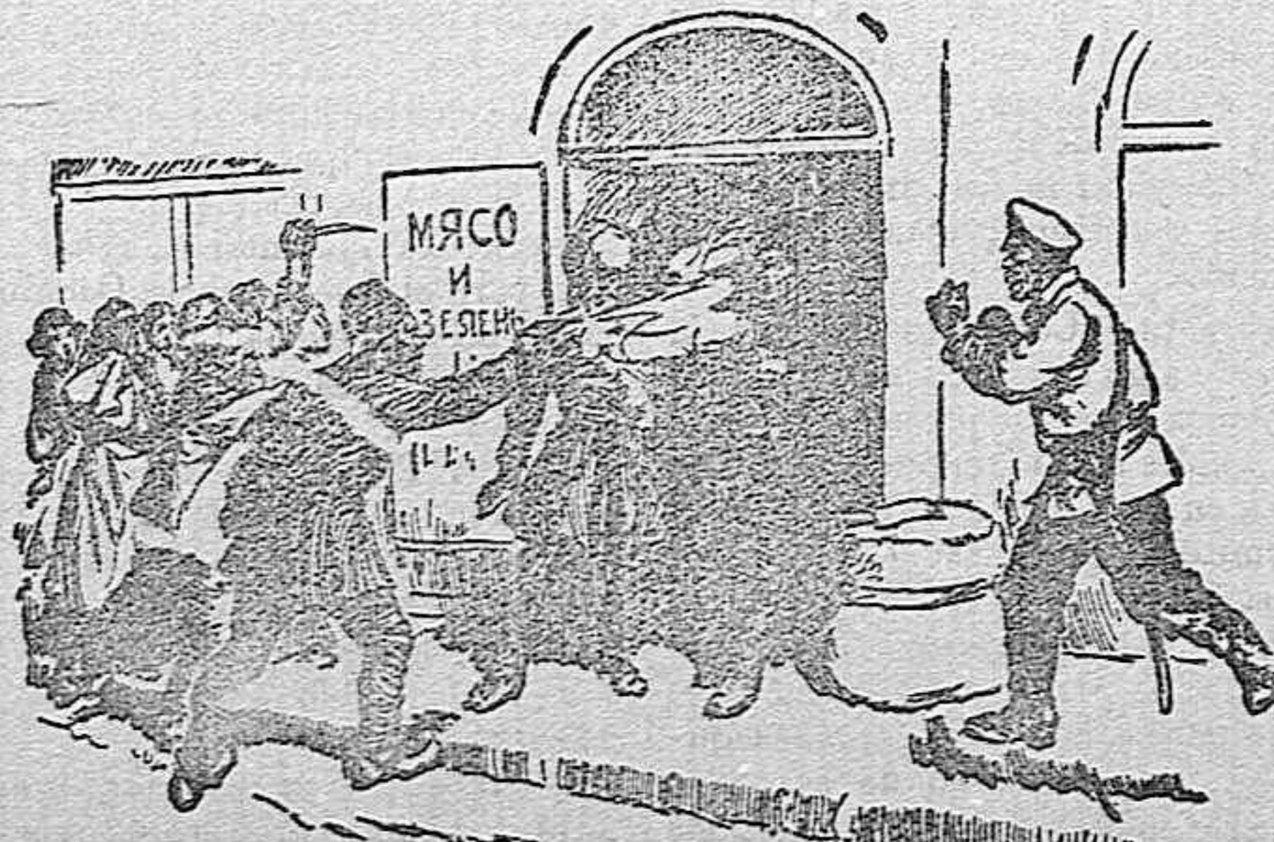
Ataque y muerte de un comerciante israelita en su domicilio