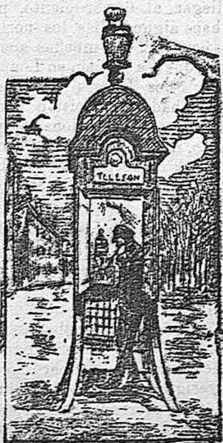
La ciencia telefónica avanza rápidamente. Se ensanchan sus líneas, se mul-

tiplican sus aparatos y no es aventurado asegurar que dentro de poco no habrá domicilio, por humilde que sea, sin su correspondiente teléfono.