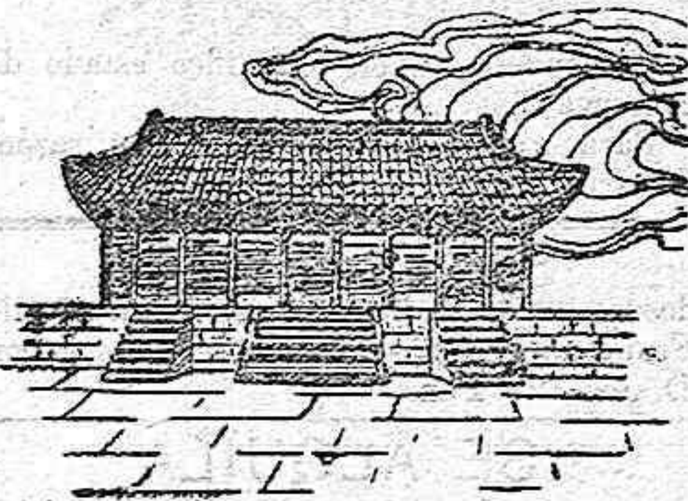
Un muro (templo coreano.)

El culto oficial comprende dos ramas bien distintas, la del mando y la del espíritu de la naturaleza. El culto del mando es antiquísimo: en el “Sam-kuk- sa-kei” (“Memoria histórica de los tres reinos”) se lee que “el 14.º año del rey Tong-myeng (24 a. C.) por el otoño, en la octava luna, Ryuboa, madre del rey, murió en el “Puye” oriental. El rey la enterró, consagrándole un templo.” En él eran enterrados como honor al “mando”, los cadáveres de los que en vida se distinguieron por su valor en la guerra ó por su talento en las cien- cias, las artes ó las letras, juntos con los de la familia real. Hoy existen va- rios templos. El de “Giong-myó, si-