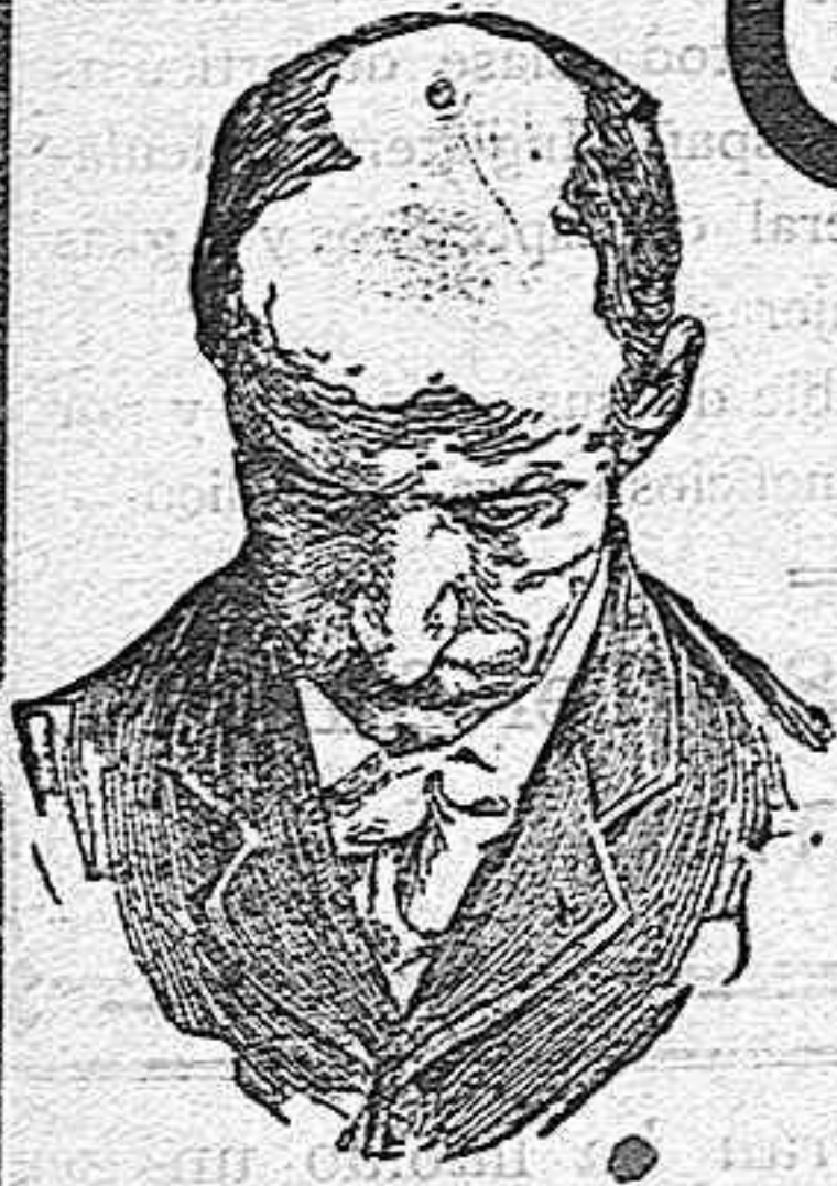
Antes de usar el Capithol