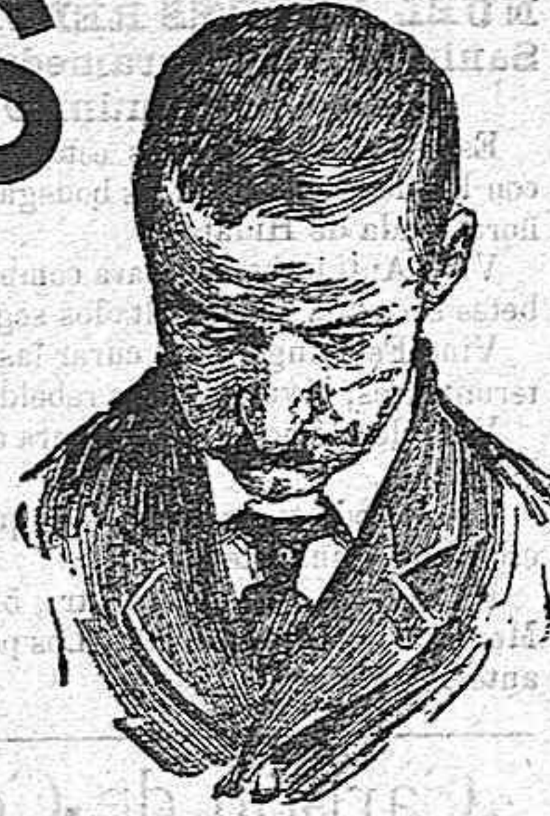
Después de usar el Capithol