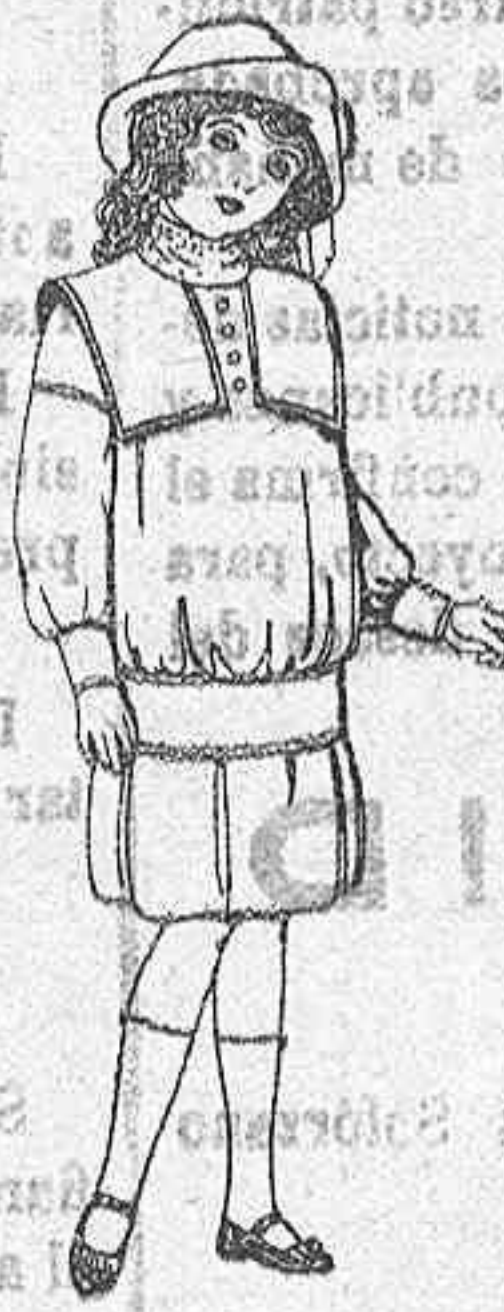
Vestidos de lanilla para niñas de 4 a 12 años, De Ptas. 19 a 24