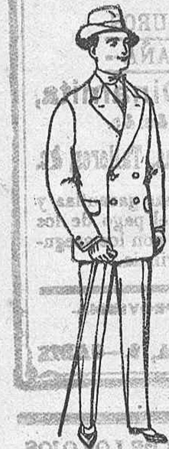
Trajes de estambre, vicuña o jerga, para niños de 10 a 16 años, De Ptas. 17 a 48.