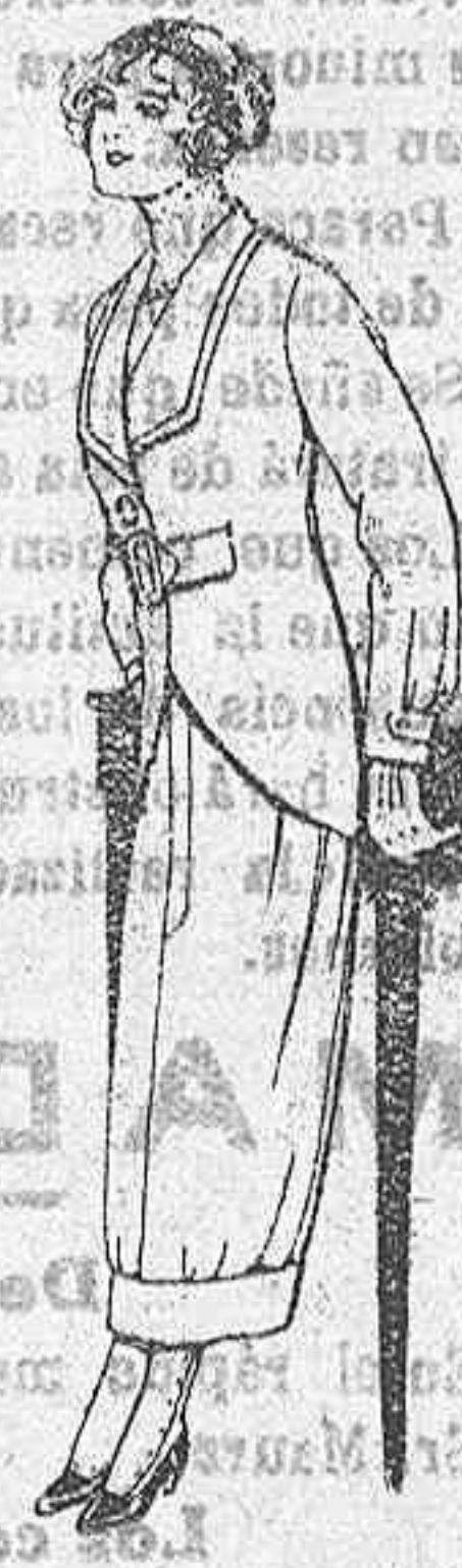
Trajes de lanilla para jovencitas de 13 a 16 años, A Pesetas 27