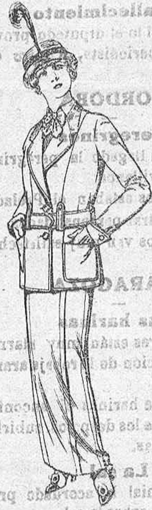
Trajes de jerga azul y negra y géneros novedad para Señora, De Ptas. 35 a 40

GORRAS, SOMBREROS DE PAJA, CINTURONES, CORBATAS, CALCETINES, FAJAS, LIGAS, TIRANTES, ETC., ETC.