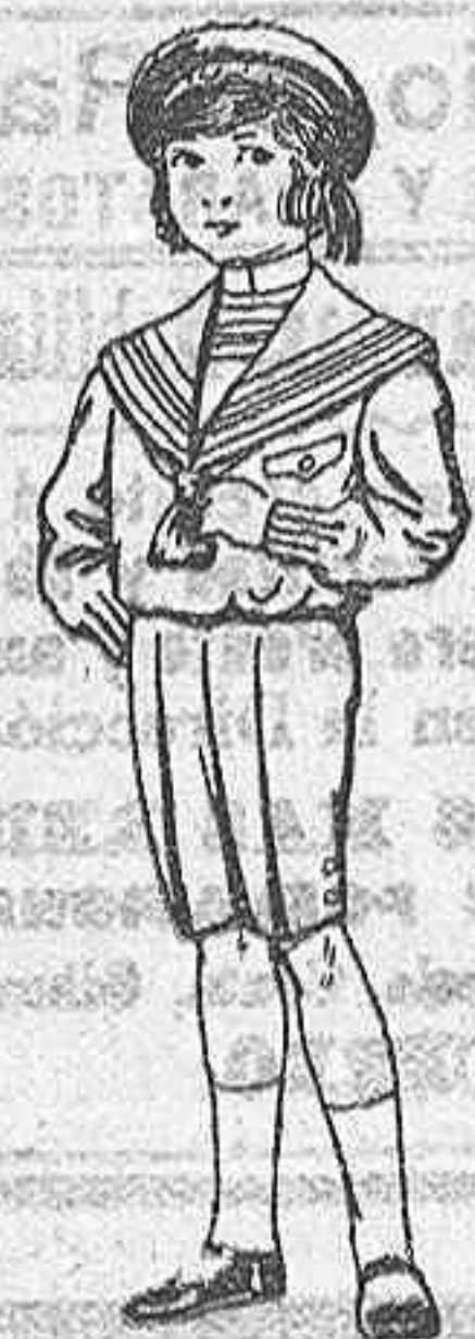
Trajes de lanilla, vicuña o jerga, para niños de 4 a 9 años, De Ptas. 6 a 31