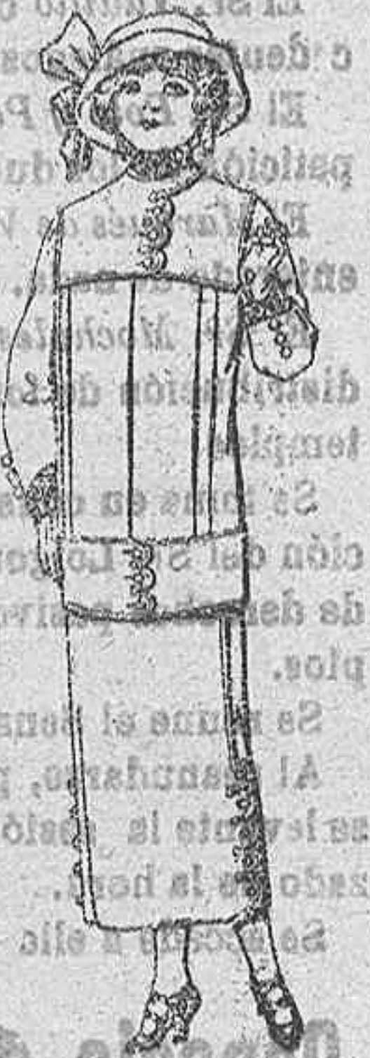
Trajes de lanilla para jovencitas de 13 a 16 años. A Pesetas 37