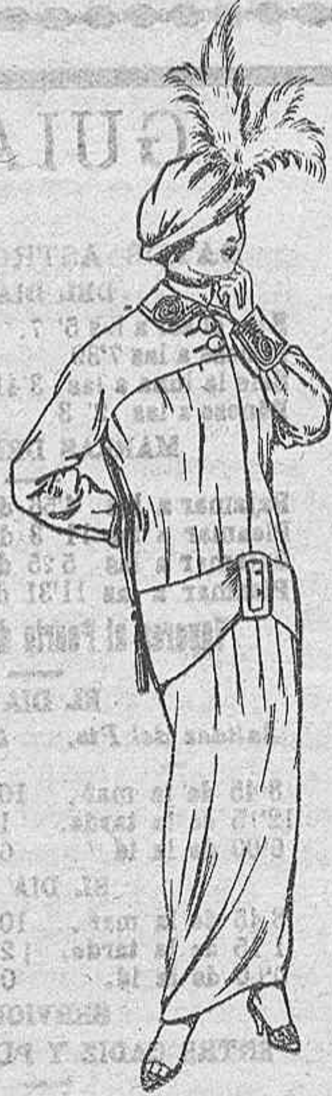
Traje de jerga negra o azul y generos novedad para Señora. A Ptas. 50 y 55