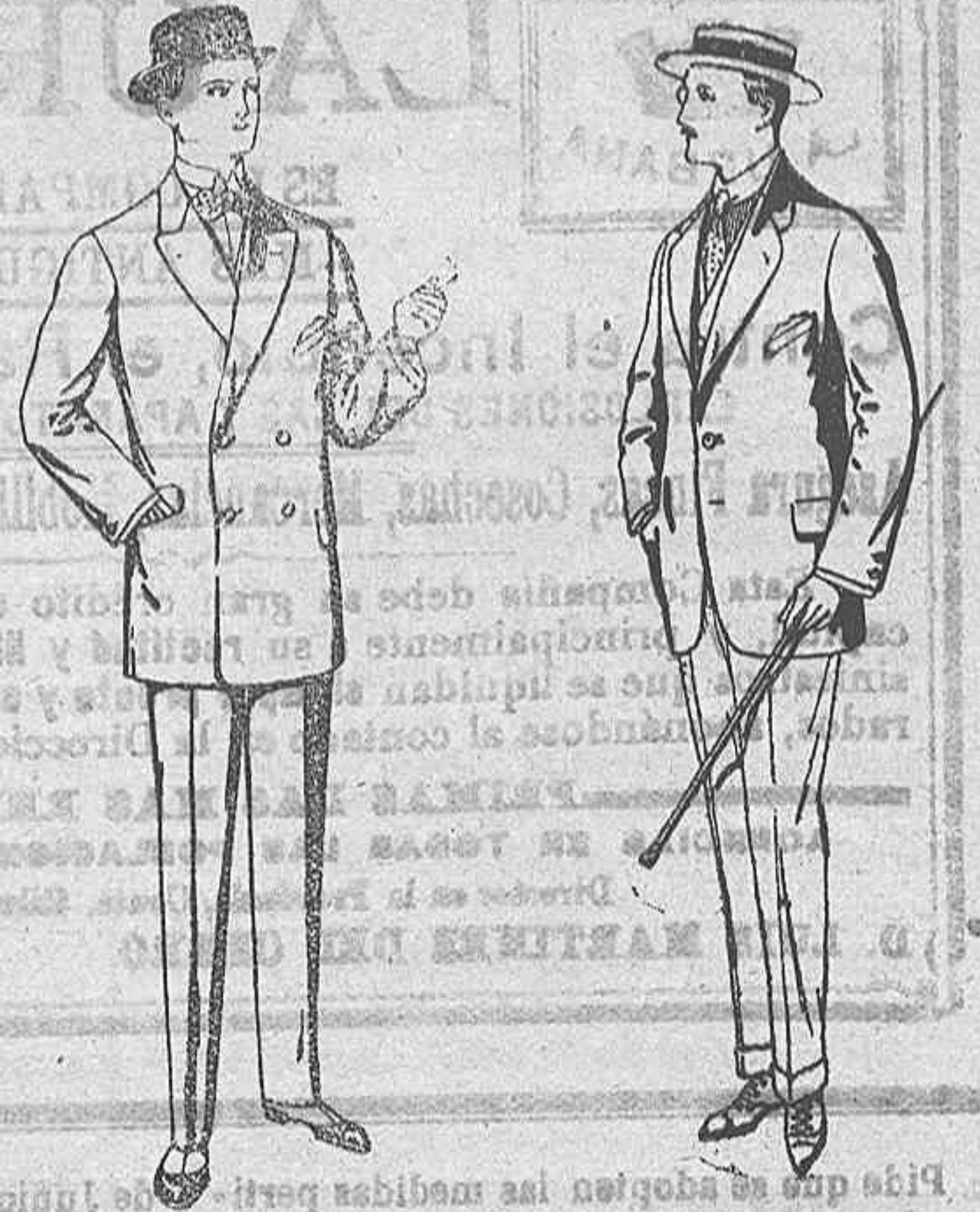
Trajes de vicuña o jerga, negros y azules. De Ptas. 35 a 73.