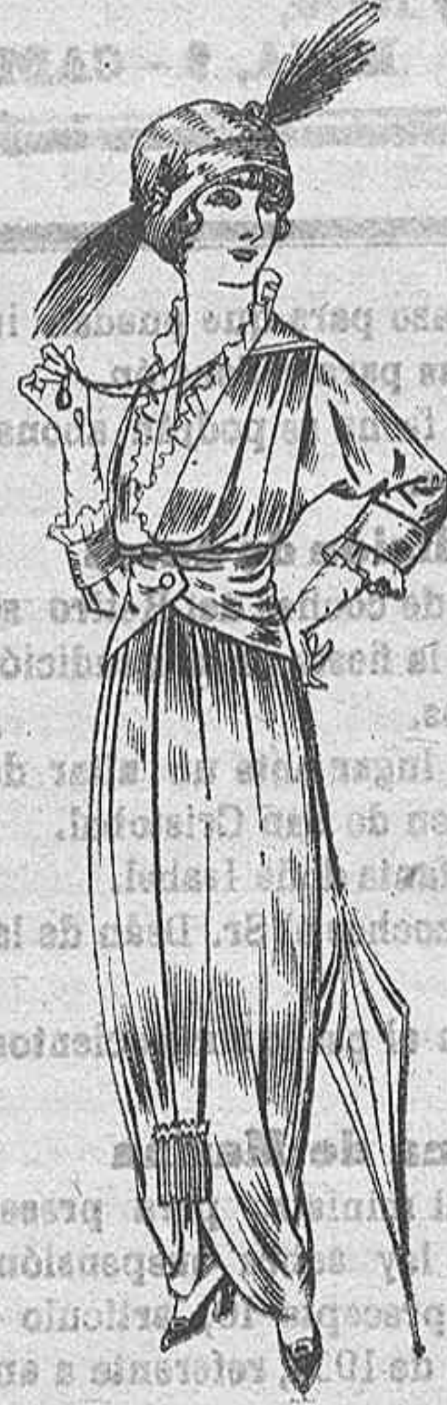
Vestido de seda negra ó azul, para Señora. De Ptas. 85 a 90