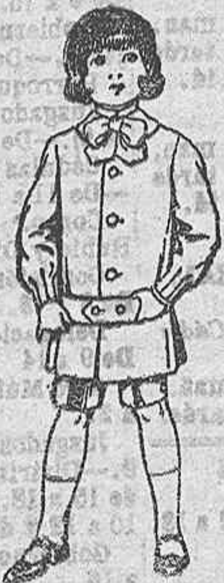
Trajes de lanilla para niños de 4 a 9 años. De Ptas. 9 a 22