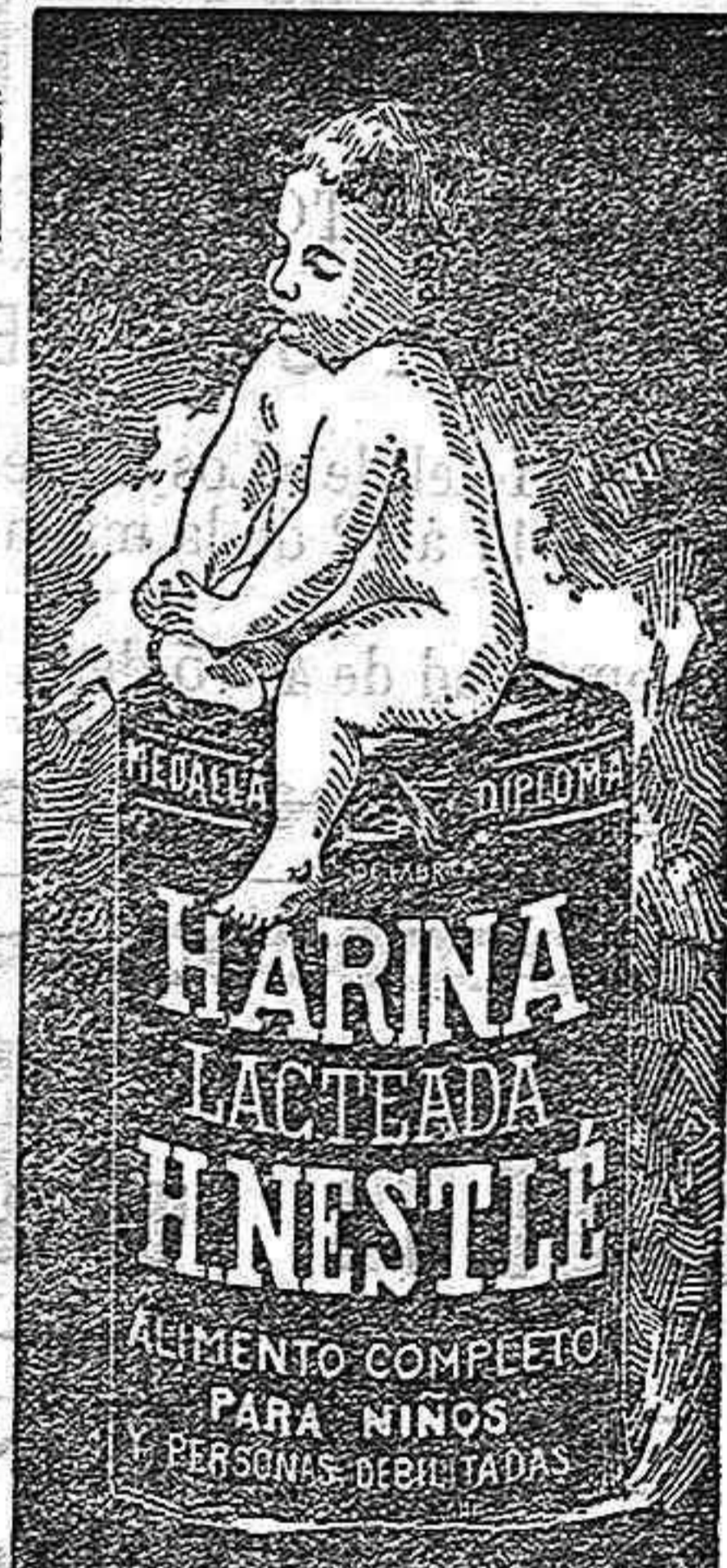
Agente general en España y en la provincia de Jerez de la Frontera.

En Jerez de la Frontera, vende estos preparades la Farmacia del BUEN SUCESO, Caballeros 12, y demás Farmacias y Droguerías bien acreditadas