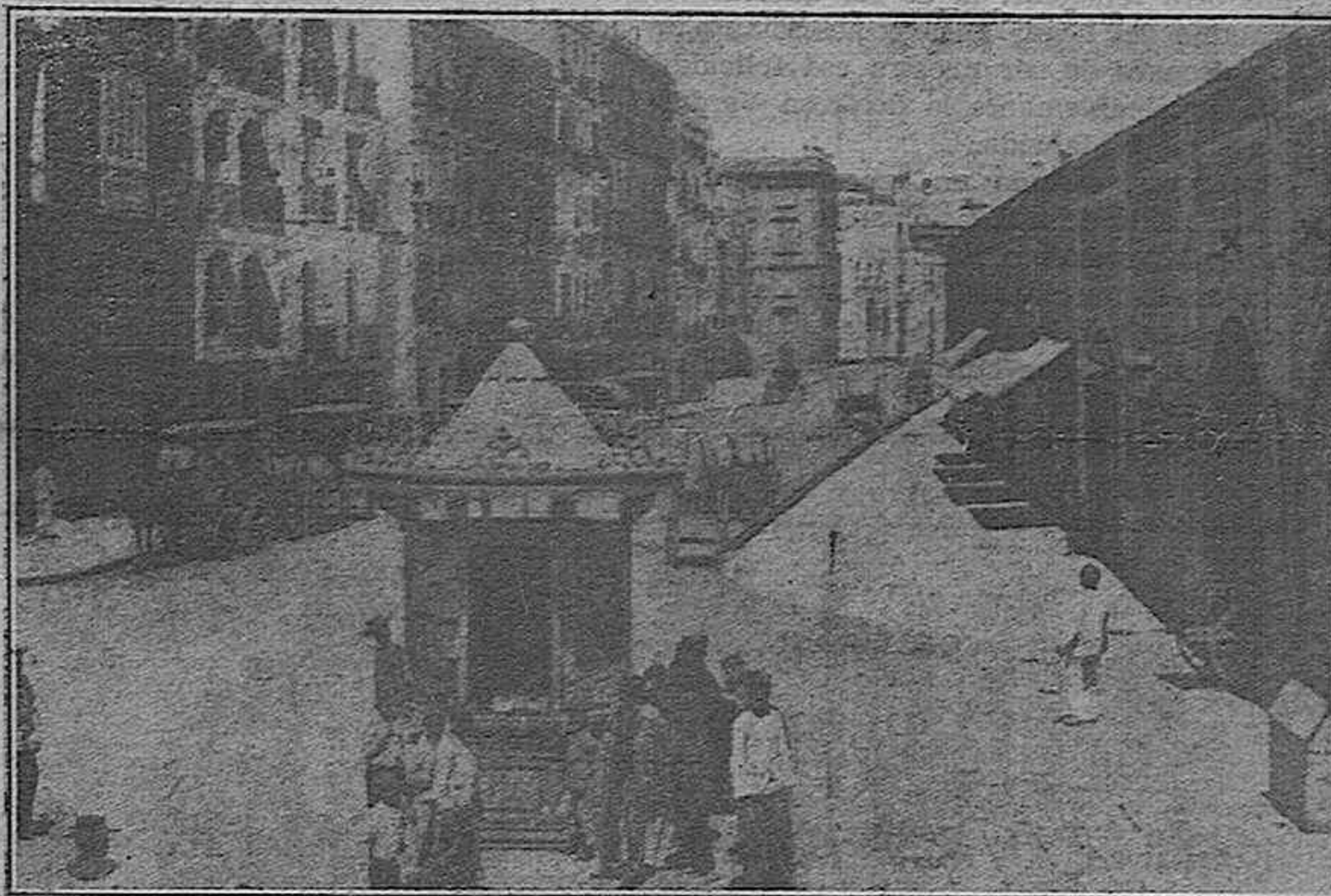
Calle de la Aduana, después de l. Peral, cuando existían las murallas. Las señales X X corresponden a las entradas por la hoy Plaza de la República, de las Puertas del Mar. (Reprod. de un grabado de la época)