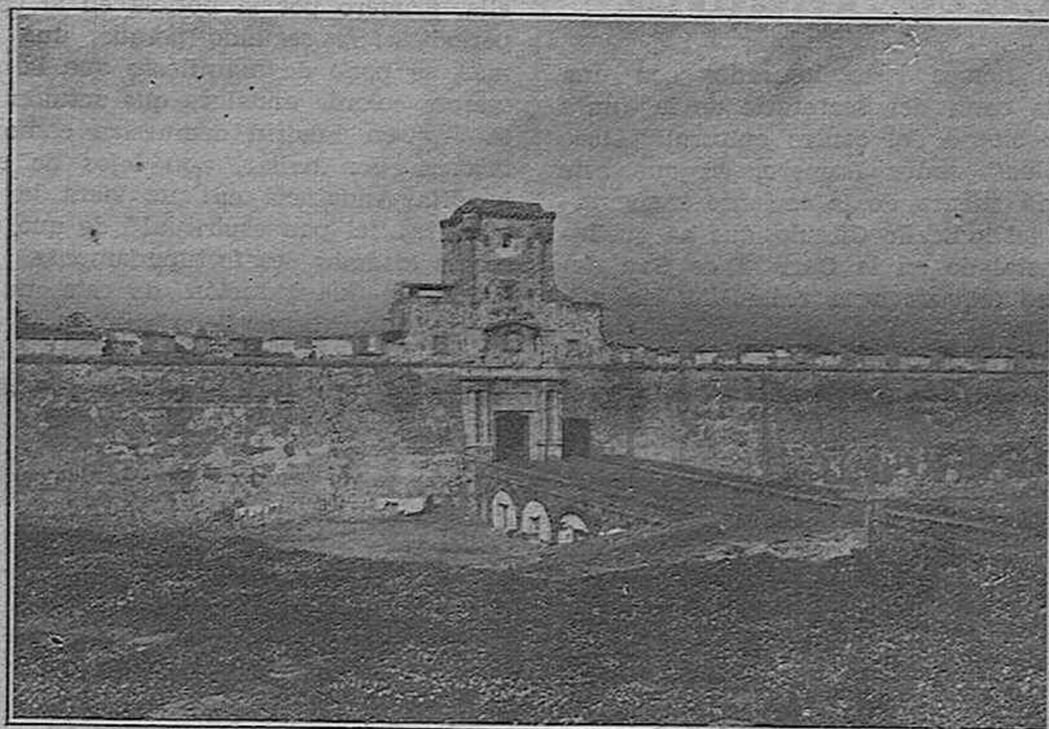
Muralla que cierra la entrada de la ciudad de mar a mar (.).

III El Ayuntamiento, desde 1861, vino instando el derribo de las murallas desde los cuarteles hasta San Carlos, y que el ensanche de la ciudad tuviera efecto pa-