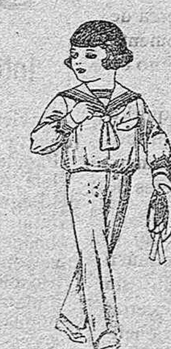
Trajes modelo «Marinera-lanilla, mel on, etc., para niños de 3 a 9 años, de ptas. 19 a 30

Los mismos en dril listado, crudo o kaki,