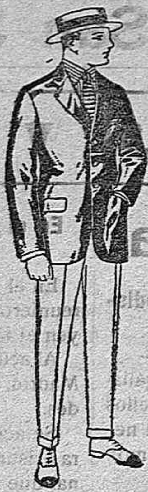
Trajes de alpaca negra o azul, de ptas. 70 a 95 Americanas de alpaca negra o azul, de ptas. 29 a 60 Pantalones de dril listado, de ptas. 6'50 a 18