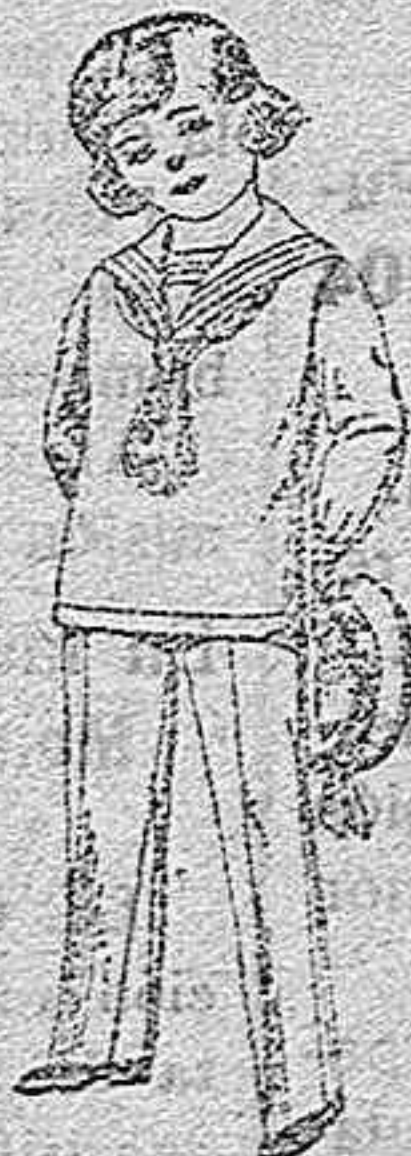
Trajes modelo «Marinera Inglesa», de vicuña o estambre azul y negro, para niños de 3 a 9 años, de ptas. 28 a 50

Los mismos en dril listado, crudo o kaki,