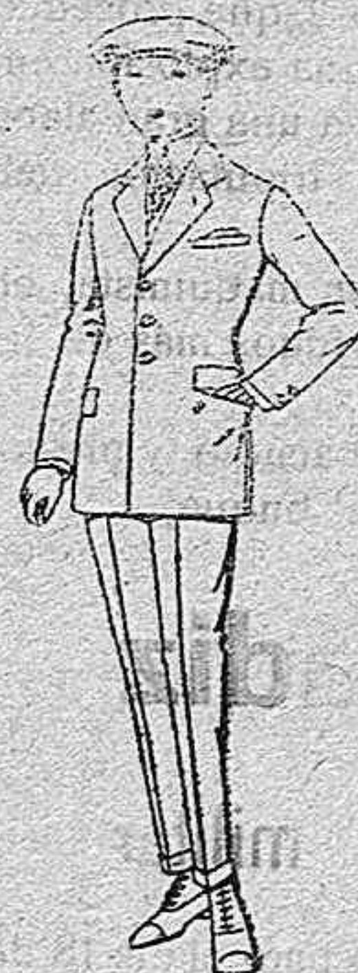
Trajes modelo «Sport», de lanilla, melton, etc., para jóvenes de 10 a 16 años, de ptas. 35 a 85