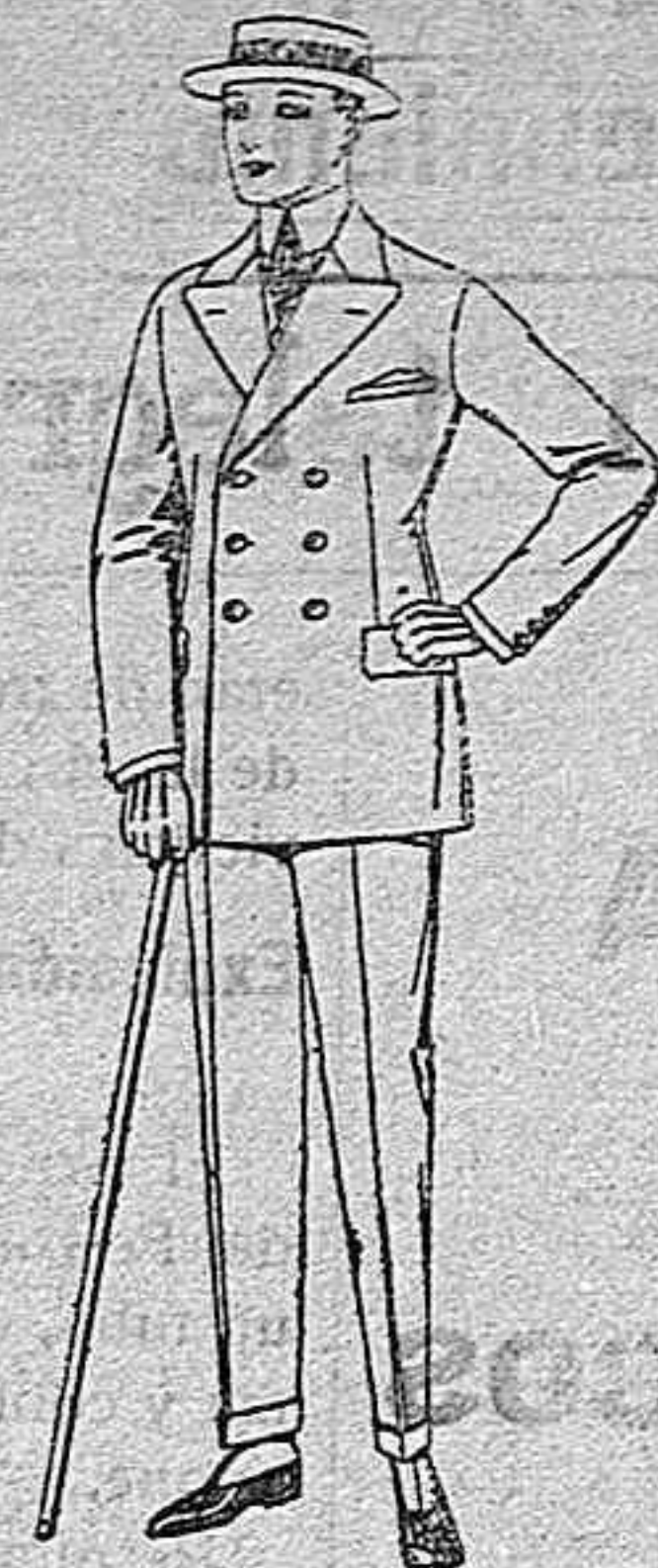
Trajes de lanilla, melton, estambre, vicuña o jerga, de ptas. 38 a 135