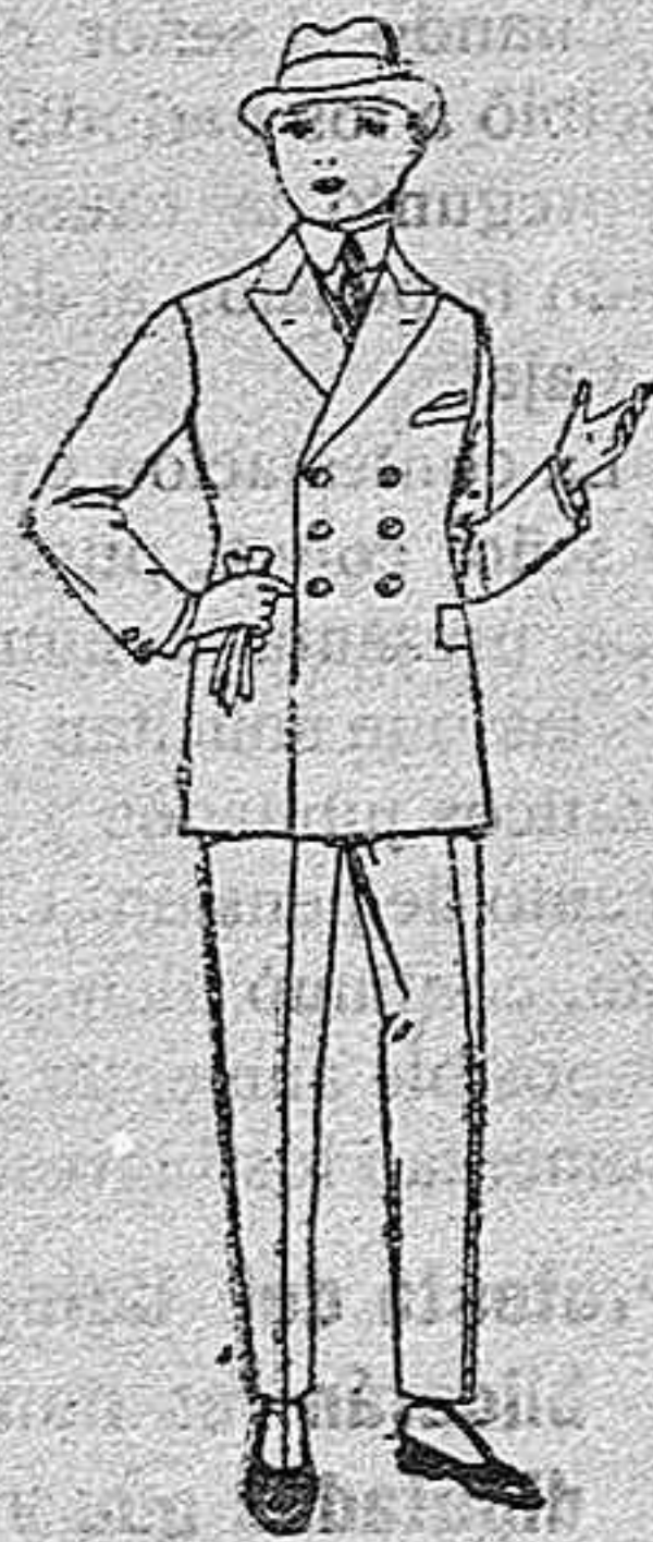
Trajes de lanilla, vicuña o estambre, para jóvenes de 10 a 16 años, de ptas. 33 a 85