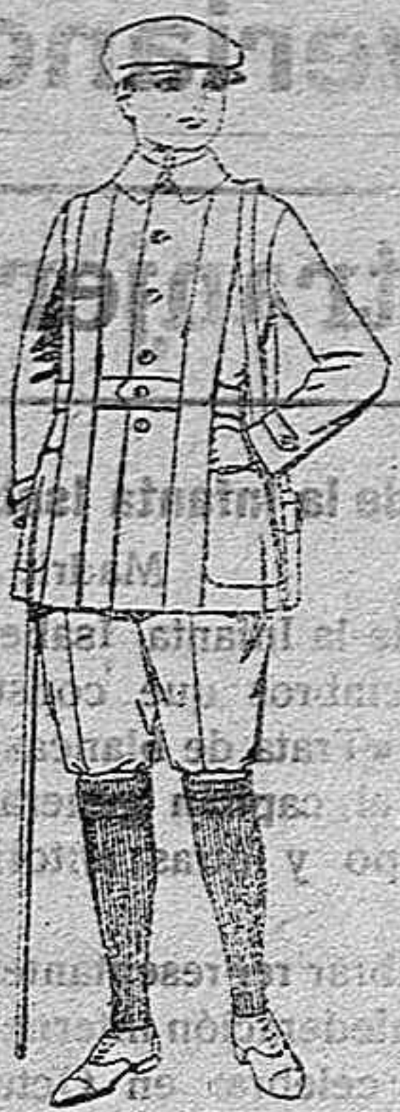
Cazadoras de dril crudo o kaki, de ptas. 18 a 30 Pantalones cortos de dril beige o gris, para excursionistas, de ptas. 8 a 18

SUCURSALES: Madrid, Barcelona, Alicante, Almería, Bilbao, Cádiz, Cartagena, Gijón, Granada, Málaga, Palma de Mallorca, Santander, Sevilla, Valencia, Valladolid, Zaragoza