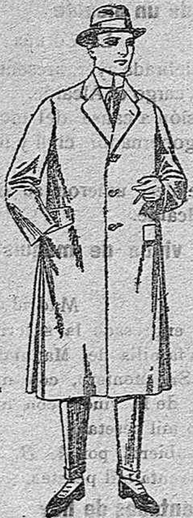
Gabanes de gamuza, melton, etc., de ptas. 48 a 185