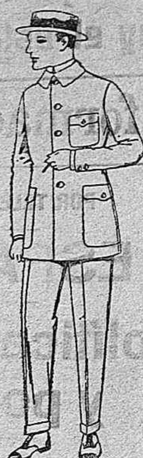
Guerreras de dril crudo, kaki o blanco, de ptas. 12,50 a 18 Pantalones de dril crudo, kaki o blanco, de ptas. 6'50 a 19