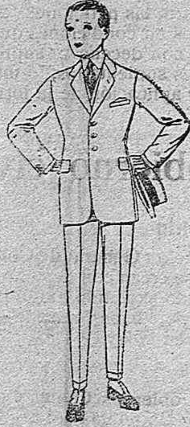
Trajes de lanilla, melton, vicuña, etc., para jóvenes de 10 a 16 años, de ptas. 30 a 80