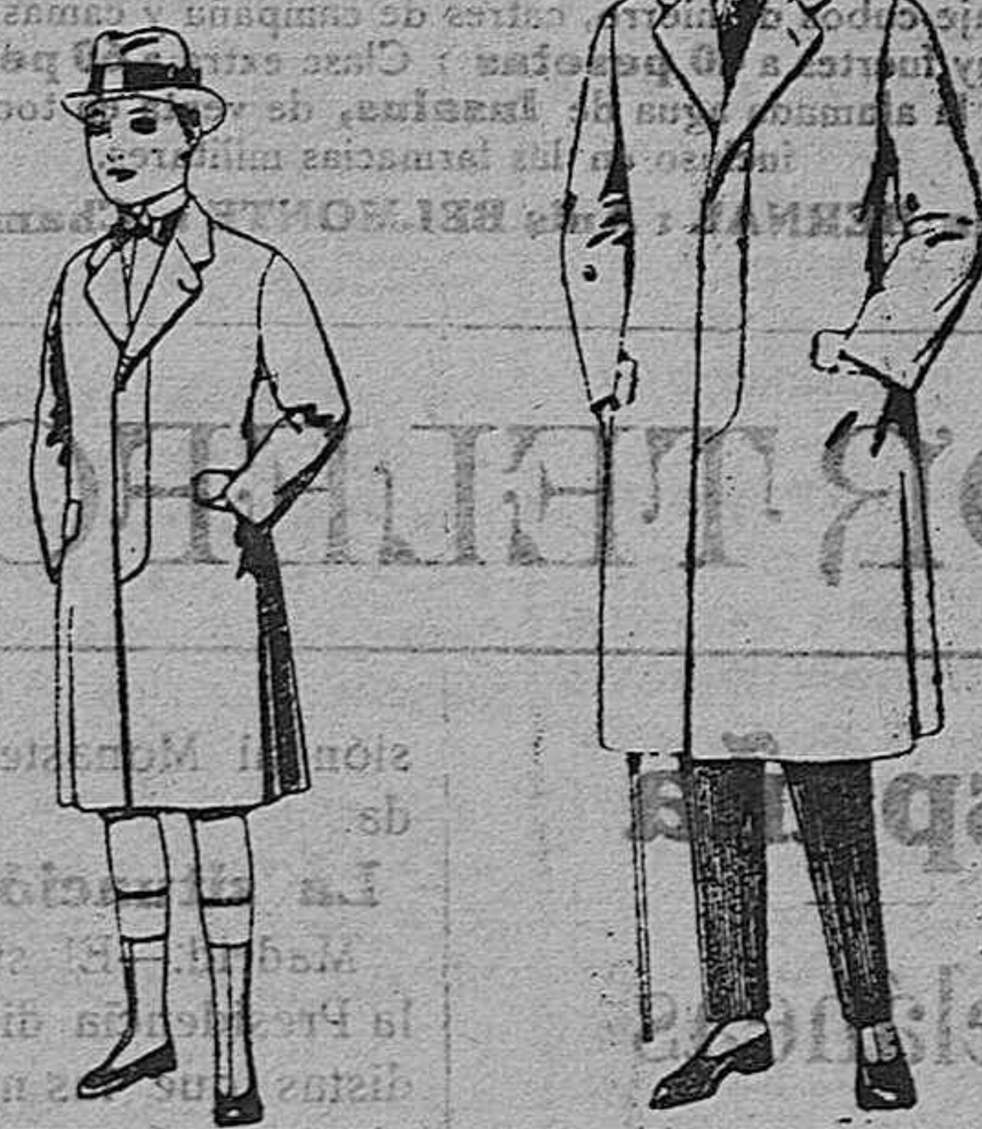
Gabanes de patén, para niños de 11 a 15 años, de ptas. 18 a 63. Gabanes de patén, melton o cheviot, con forro de seda, satén o escocés, de ptas. 30 a 110.