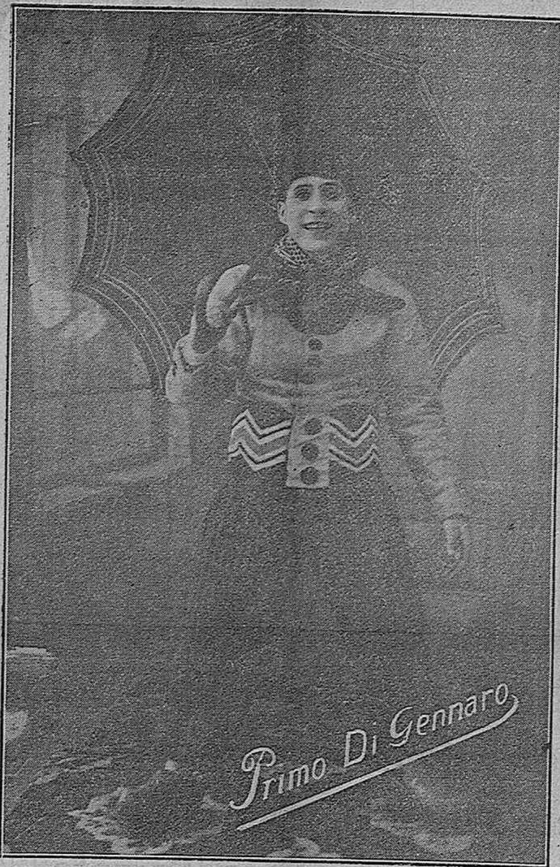
El más notable COMICO de la opereta italiana. Figura principal de la compañía que el próximo lunes 1.º debutará en nuestro Gran Teatro.