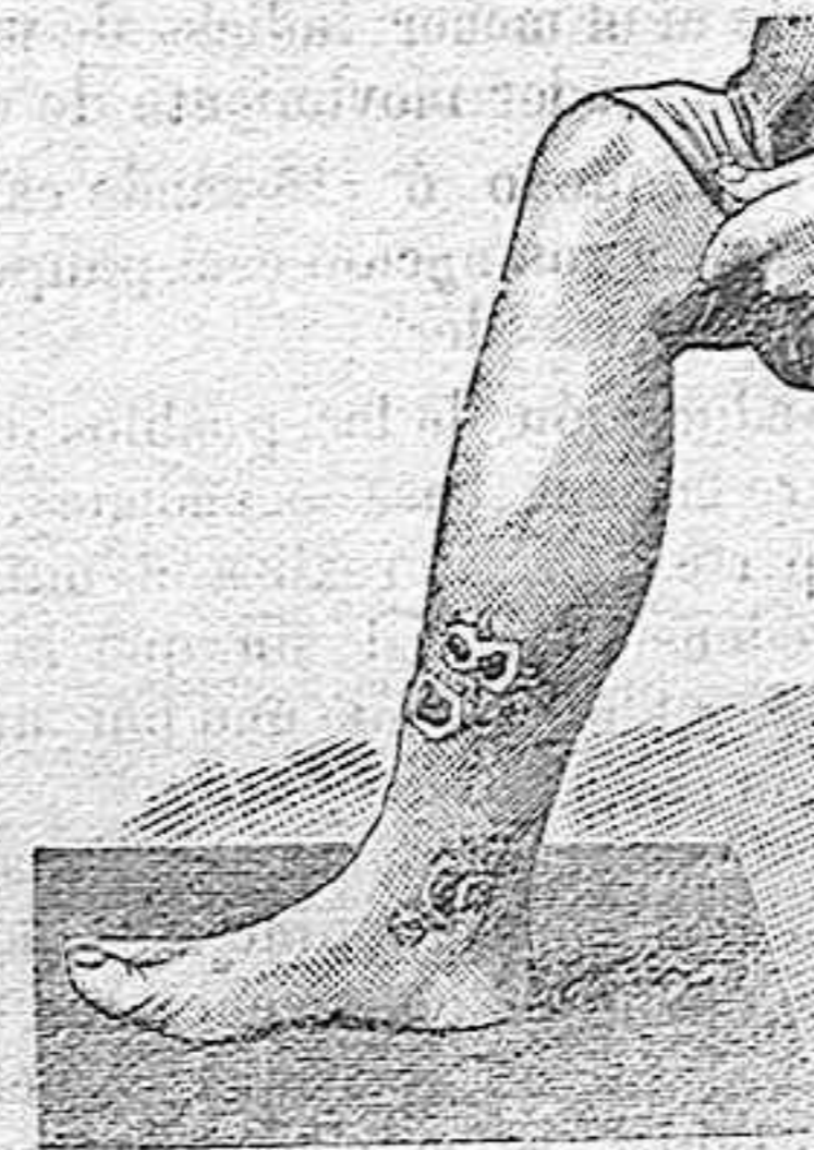
Antes de la curación.